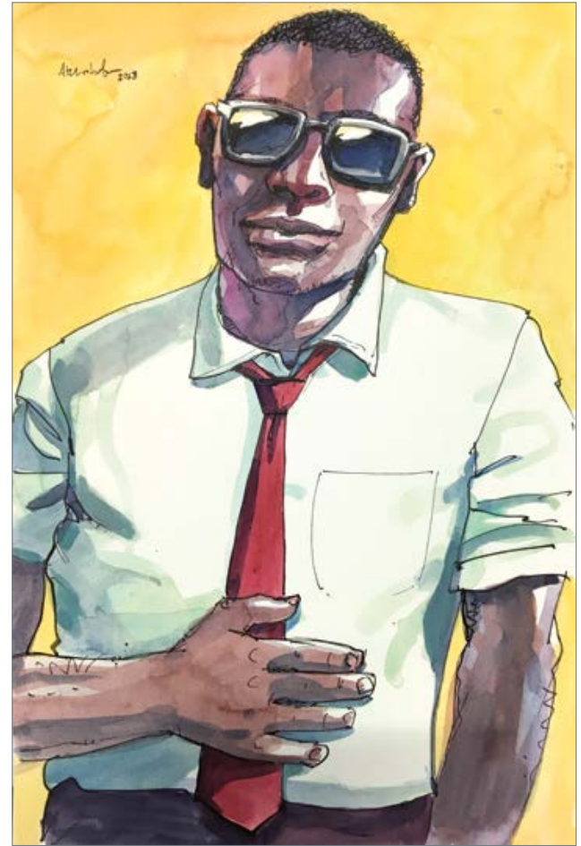
Mr. Big Stuff 30 x 20 cm