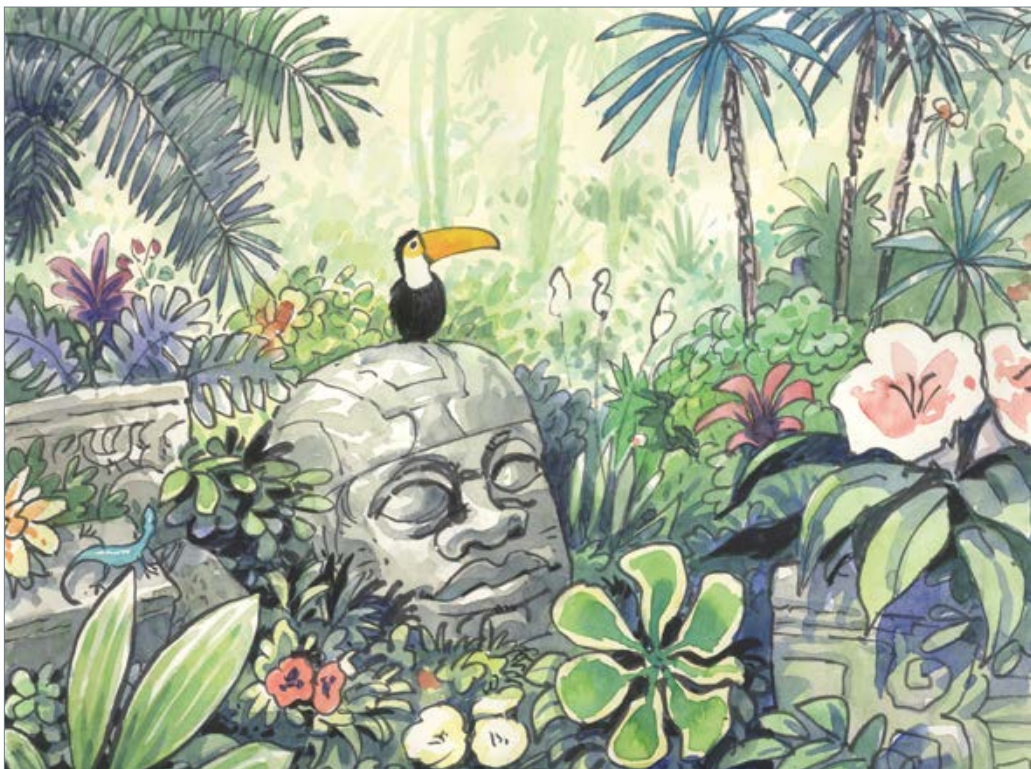
Seelenverwandte 50 x 60 cm