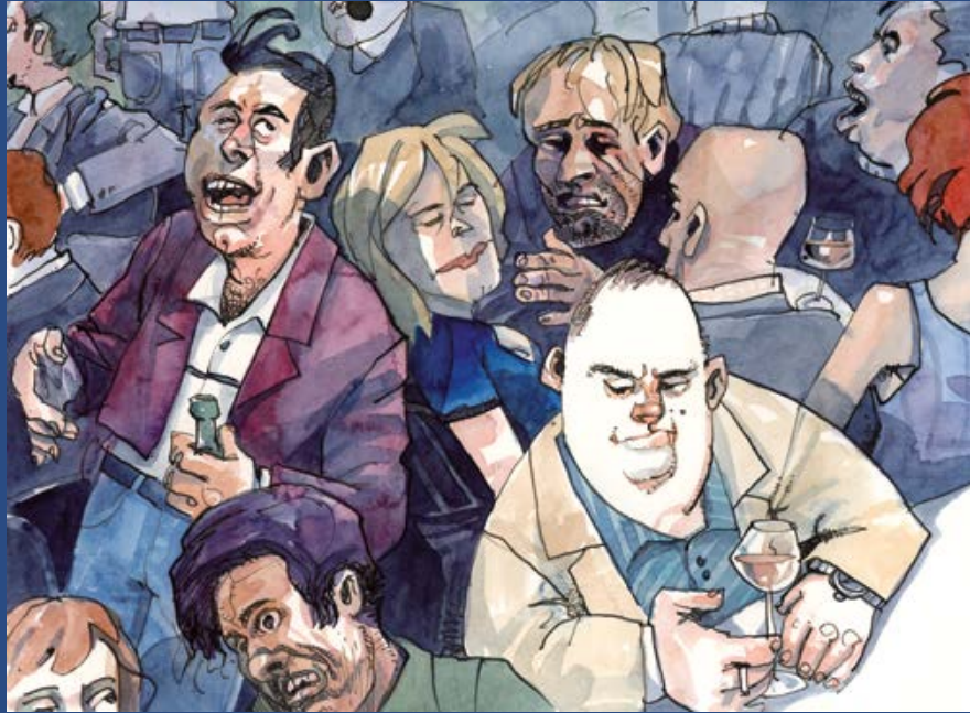
Der Ruhepol 40 x 50 cm