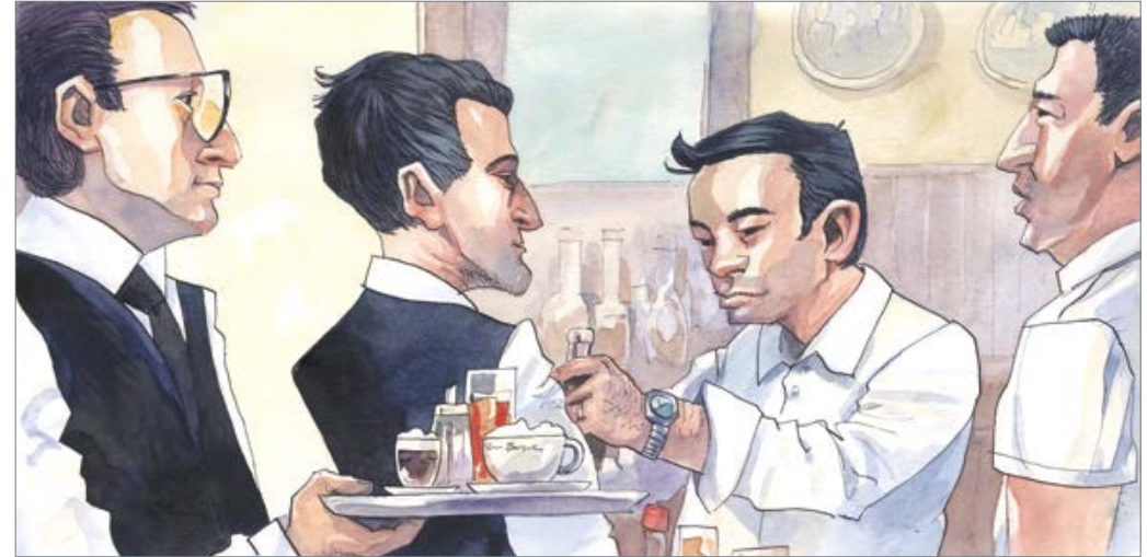
Kompetenz 30 x 60 cm