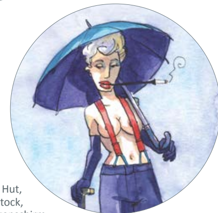
Kein Hut, ein Stock, ein Regenschirm