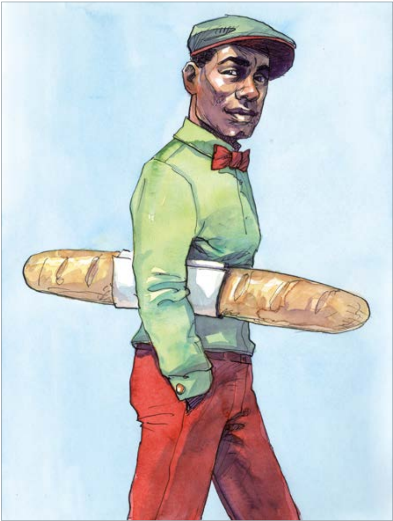
I love Paris (Cole Porter) 50 x 40 cm