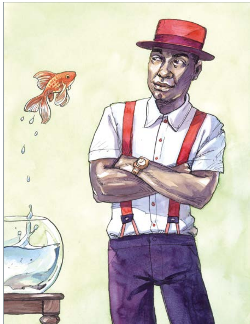
Aquarius (Hair) 50 x 40 cm