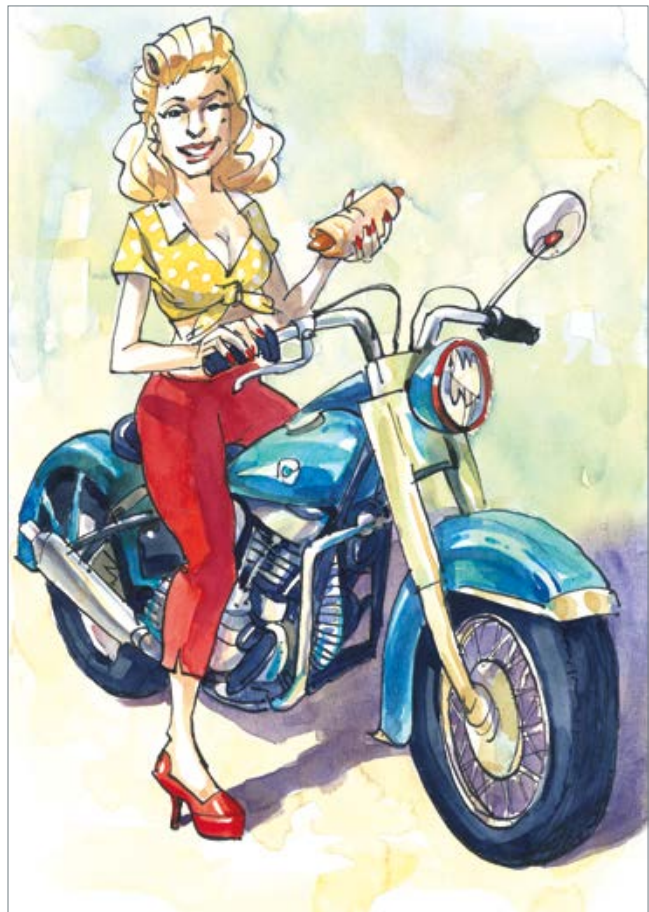
Hot Dog 40 x 30 cm