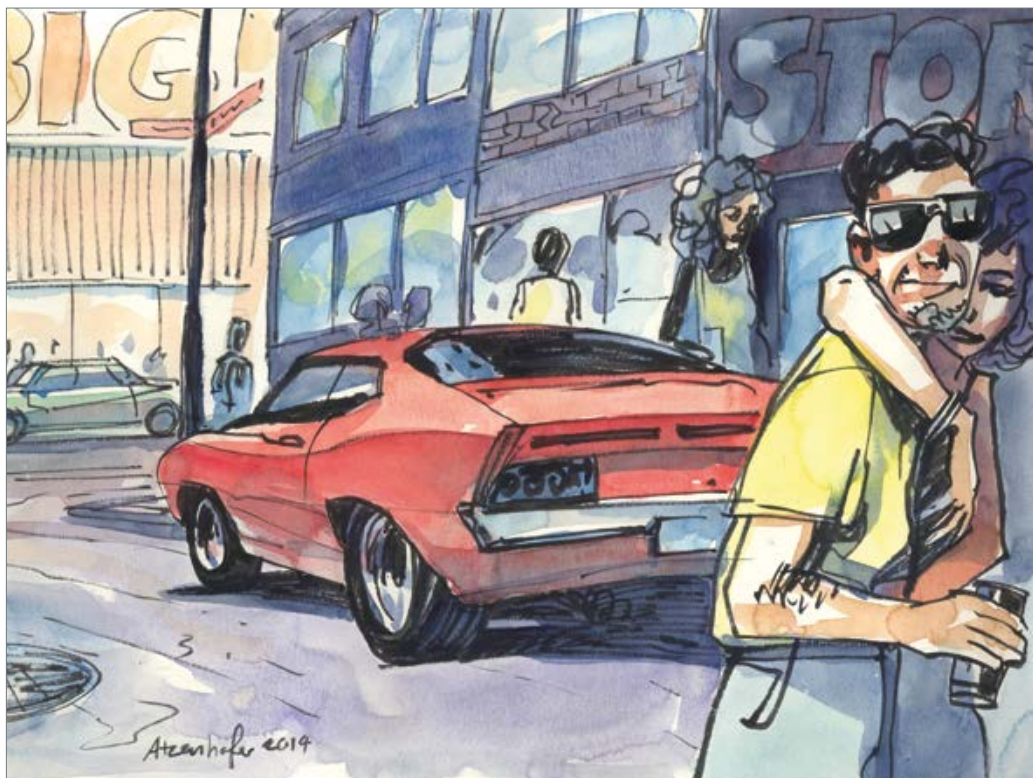
BIG 50 x 60 cm