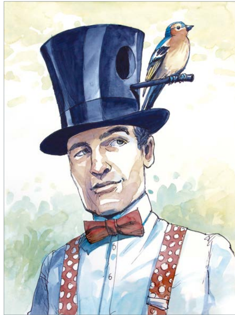
Der Sommer 60 x 50 cm