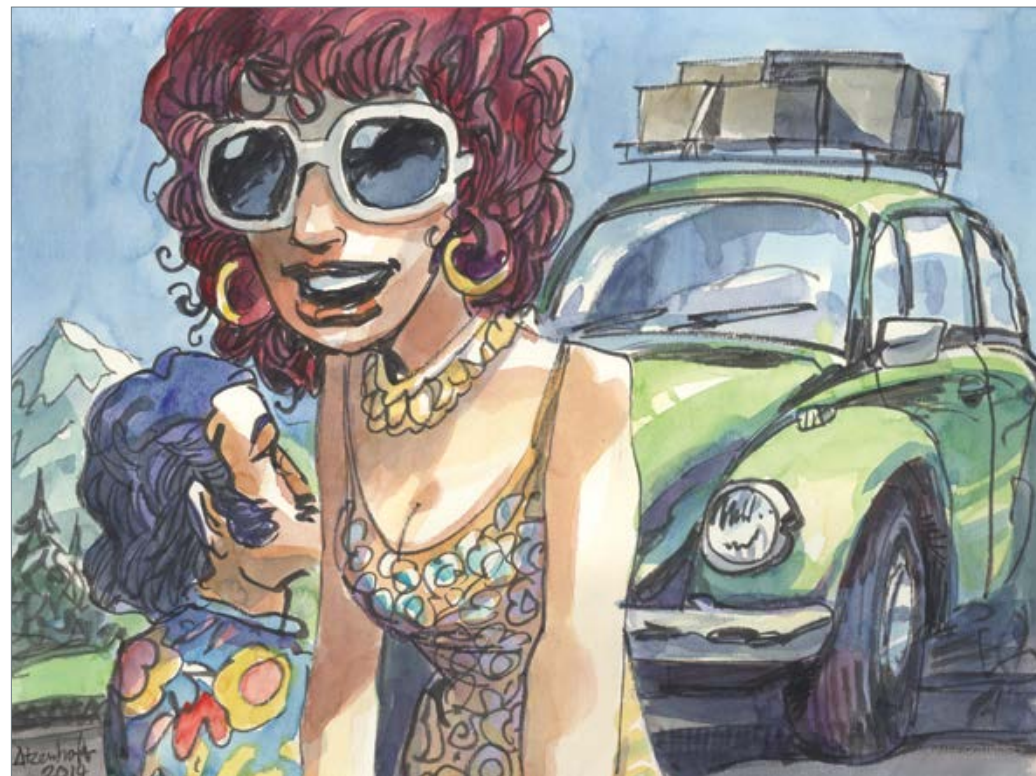
Alpenüberquerung 50 x 60 cm