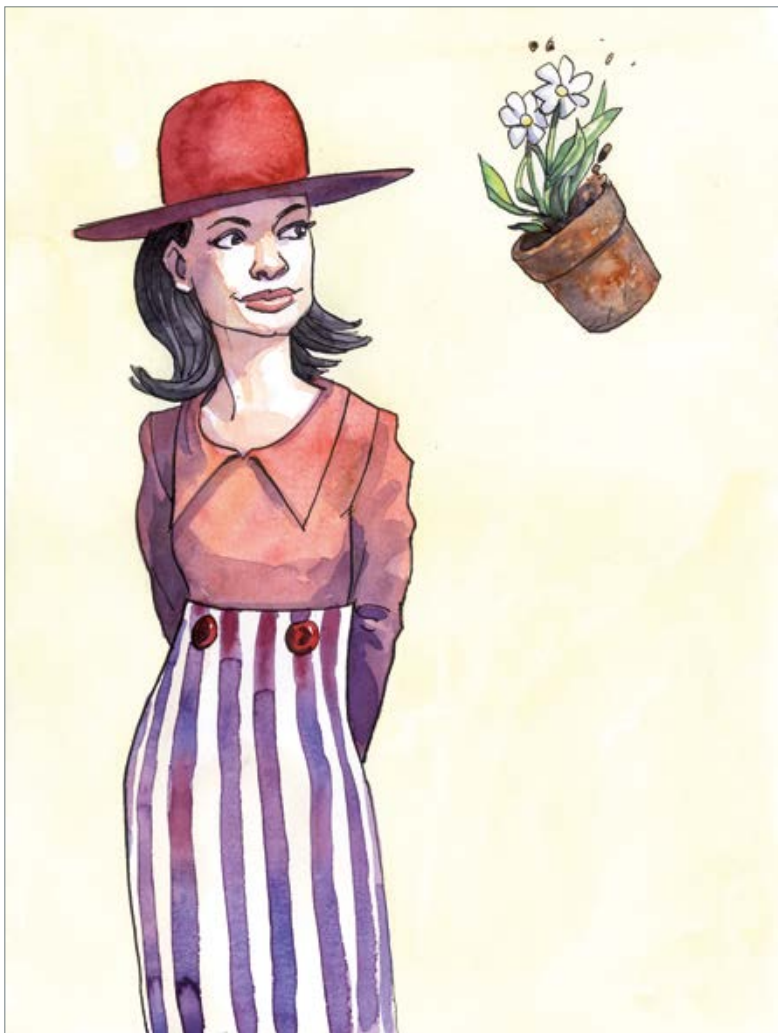
It's just a jump to the left (The Rocky Horror Picture Show) 50 x 40 cm