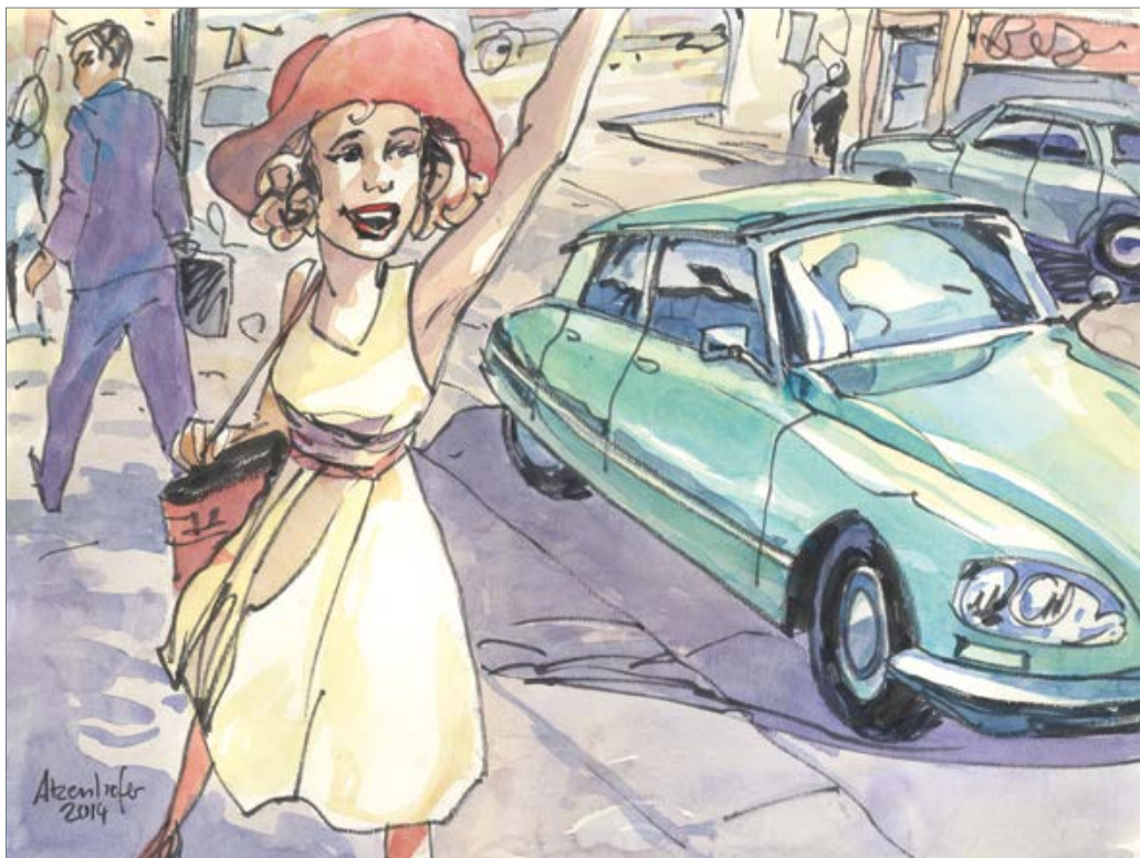
Hallo Taxi 50 x 60 cm