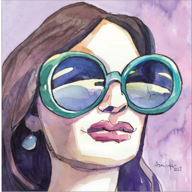
Blue Eyes 20 x 20 cm