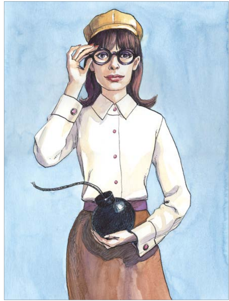
Sex Bomb (Tom Jones) 50 x 40 cm