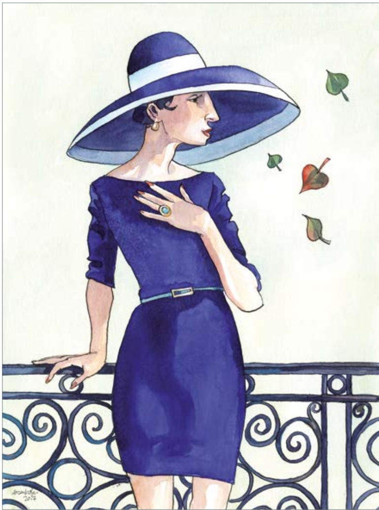
Summertime Blues (Eddie Cochran) 50 x 40 cm