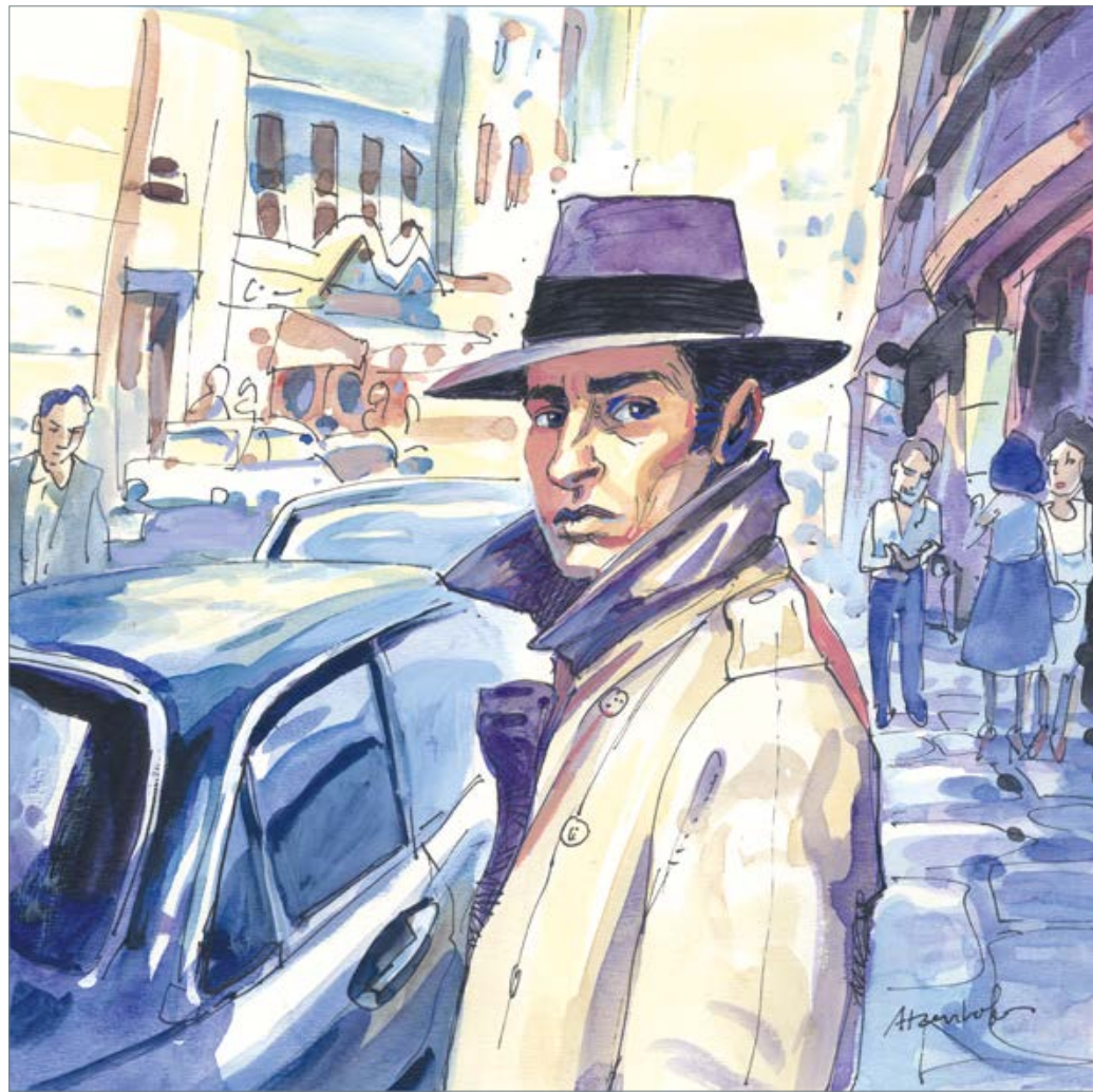
Der Auftrag 50 x 50 cm