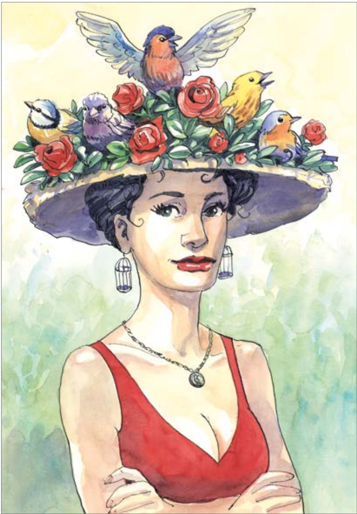
Der Frühling 60 x 50 cm