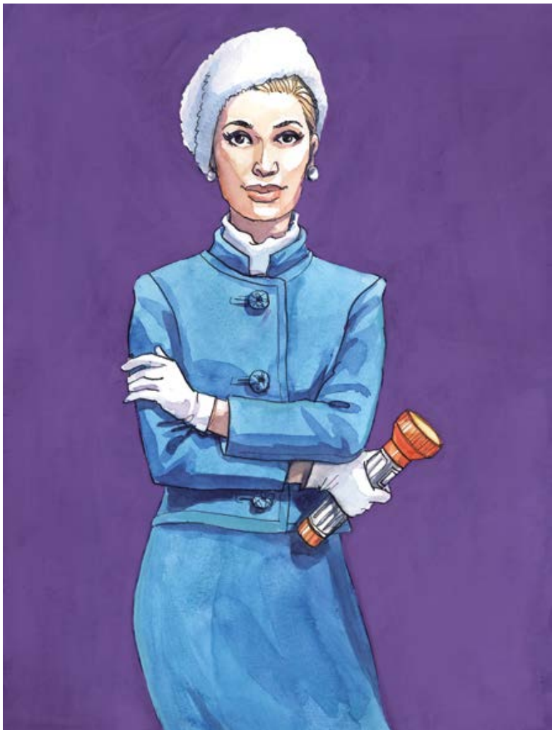
Plan B 50 x 40 cm