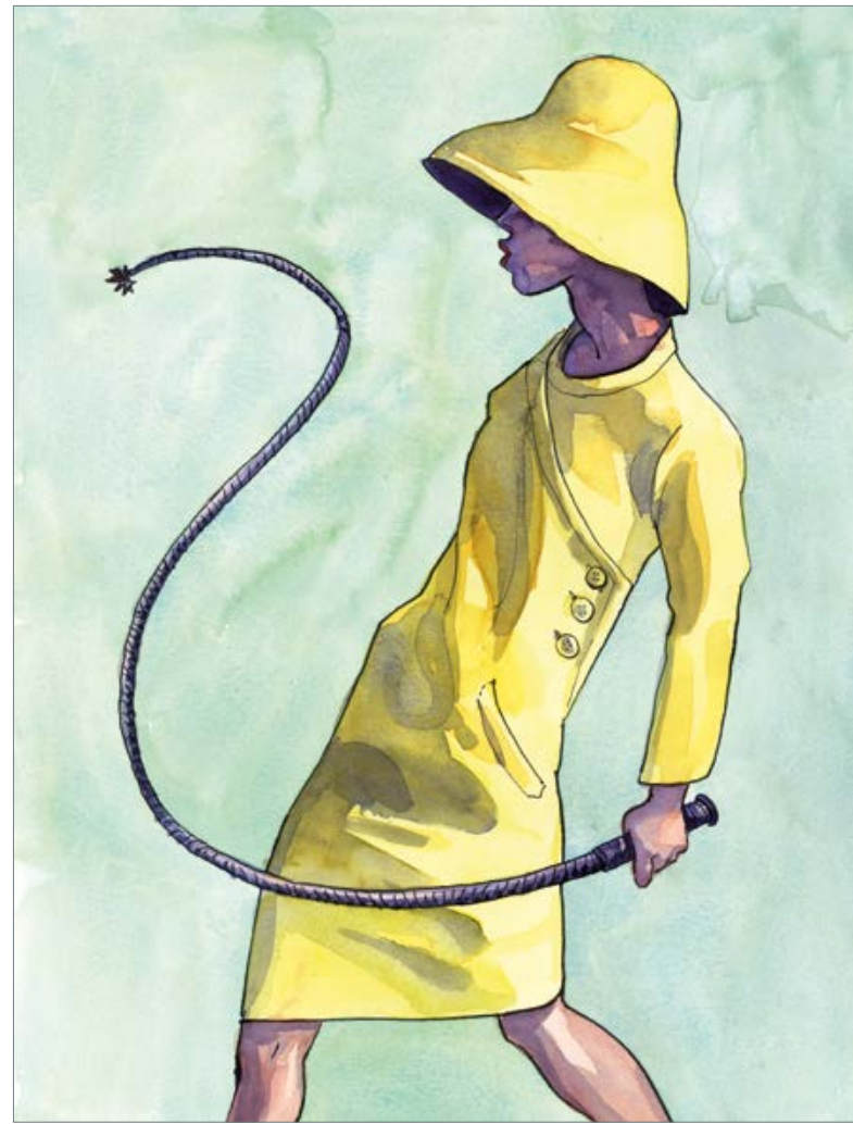
Walk on the wild side (Lou Reed) 50 x 40 cm