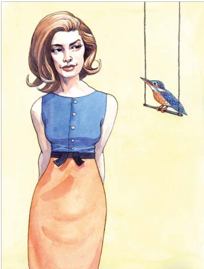
Two of us (The Beatles) 50 x 40 cm