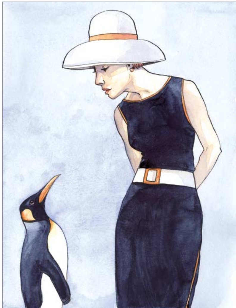
Man in Black (Johnny Cash) 50 x 40 cm