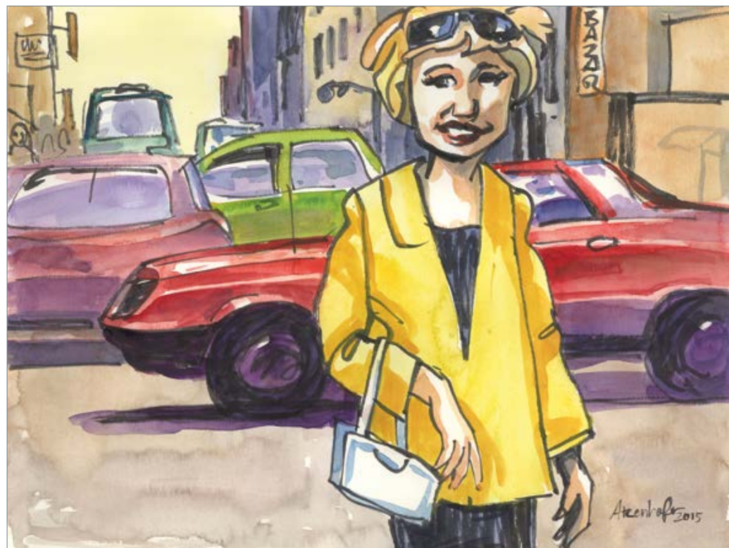
Yellow 50 x 60 cm