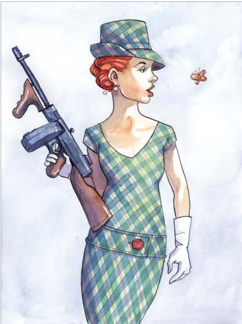
Another one bites the Dust (Queen) 50 x 40 cm