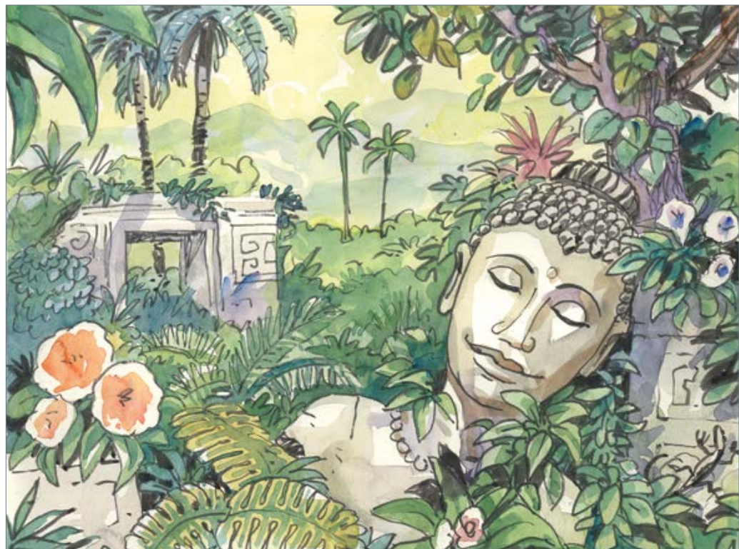
Schlafende Weisheit 50 x 60 cm