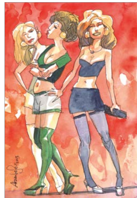
Rote Schuhe · Girls je 24 x 18 cm