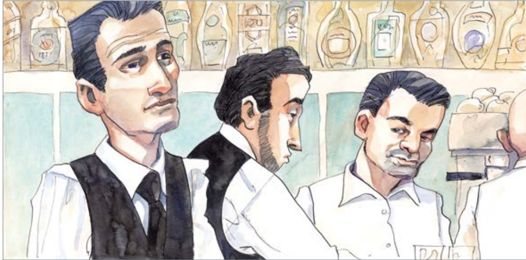
Gelassenheit 30 x 60 cm