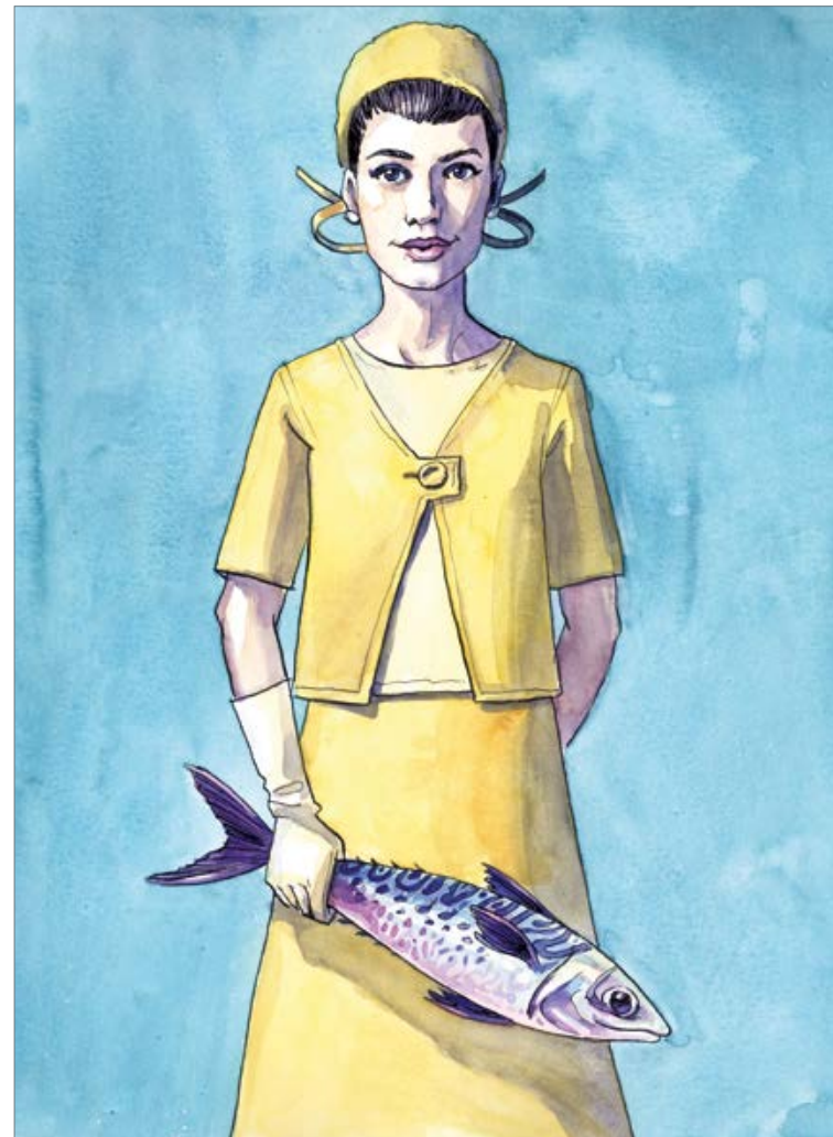
Fishing for compliments 50 x 40 cm