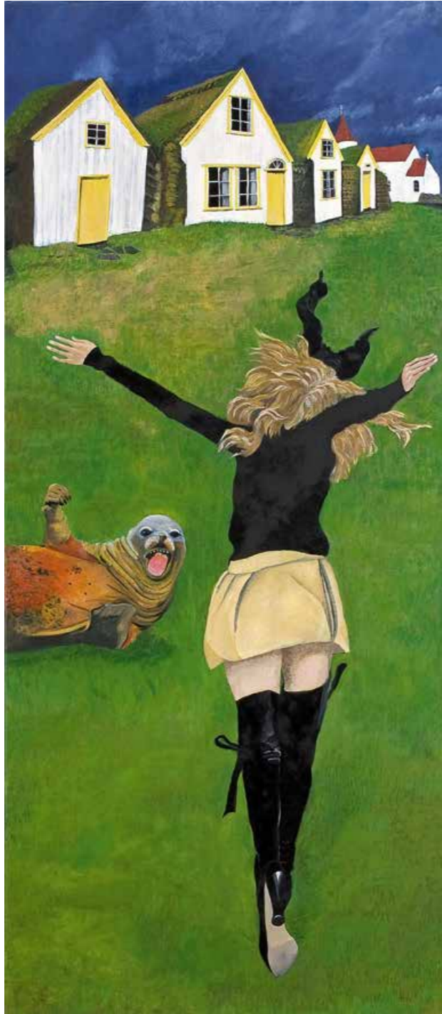
Isländische Liebe Öl auf Leinwand · 160 x 65 cm