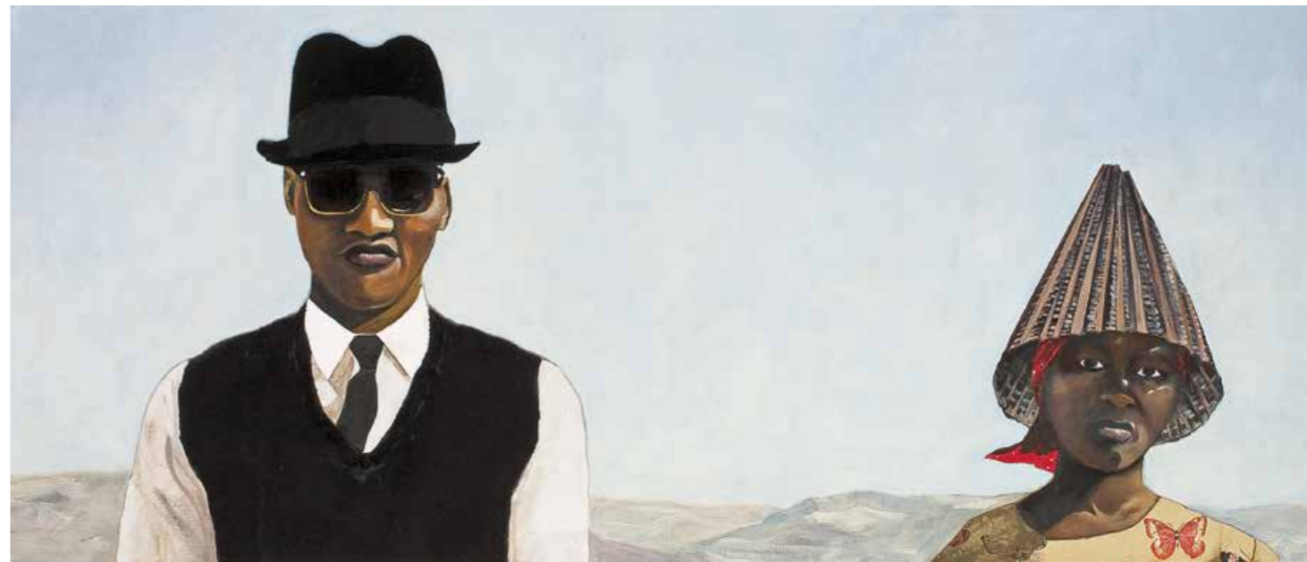
Gute Laune in Nevada Öl/Textil auf Leinwand · 60 x 140 cm