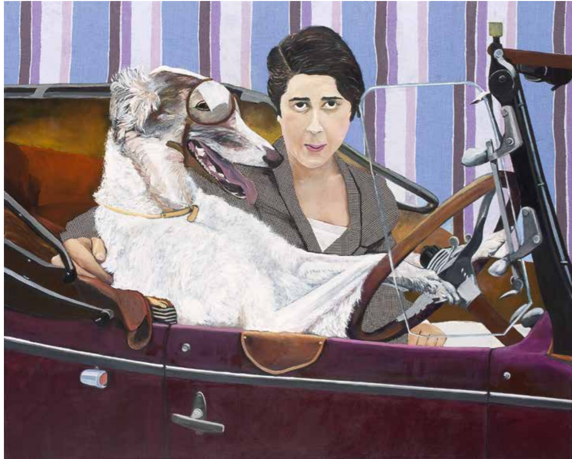
Was geht ab? Öl/Textil auf Leinwand · 100 x 125 cm