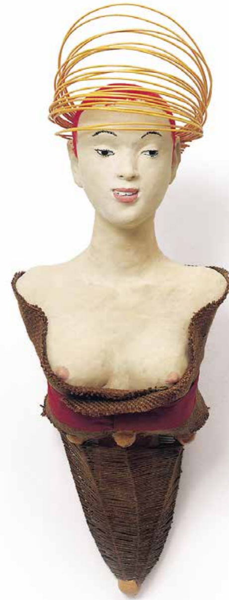
Die Vorbereitungen zur Olympiade in Peking sind in vollem Gange Skulptur · Mischtechnik · Höhe 80 cm