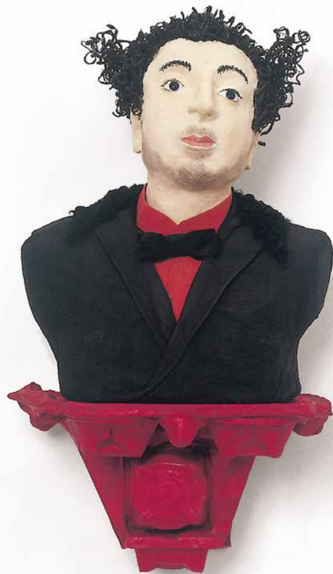
Lenins Bruder war Musiker Skulptur · Mischtechnik · Höhe 60 cm (mit Sockel)