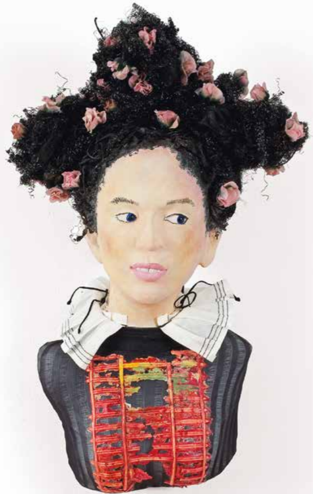
Frida – pass auf! Skulptur · Mischtechnik · Höhe 58 cm