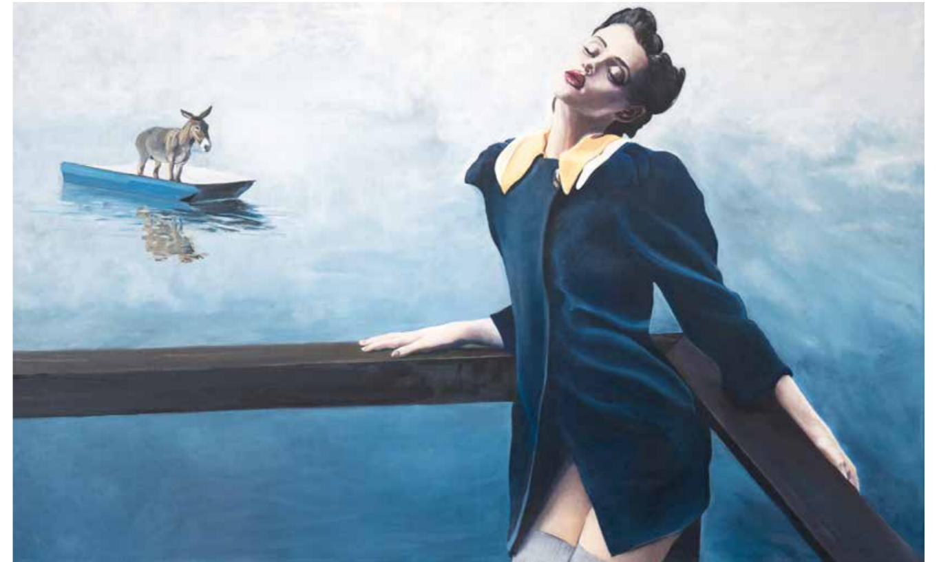
Ich komme Öl auf Leinwand · 90 x 145 cm