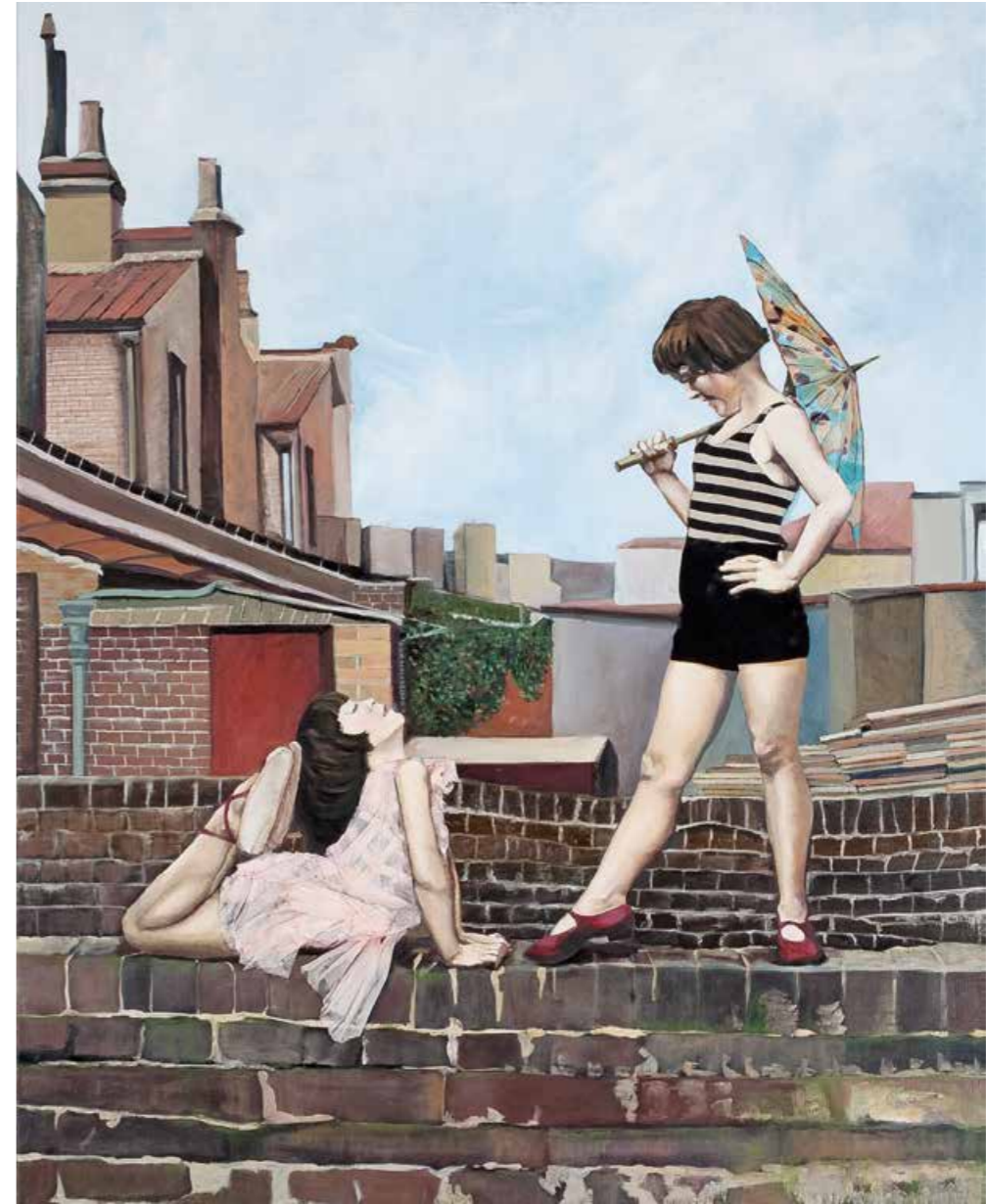
Esprit und Elegance Öl/Textil auf Leinwand · 100 x 80 cm