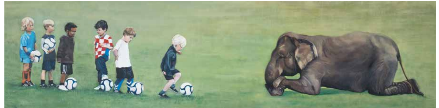
Sechs gegen Einen Öl auf Leinwand · 41 x 160 cm