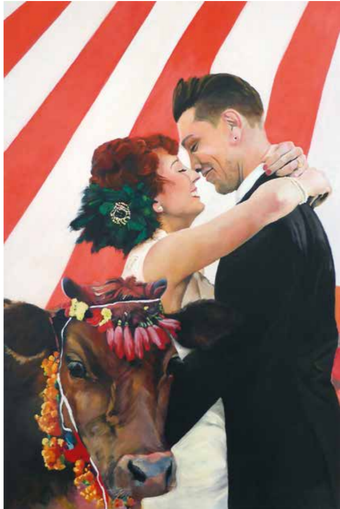
Der Trauzeuge Öl auf Leinwand · 90 x 60 cm