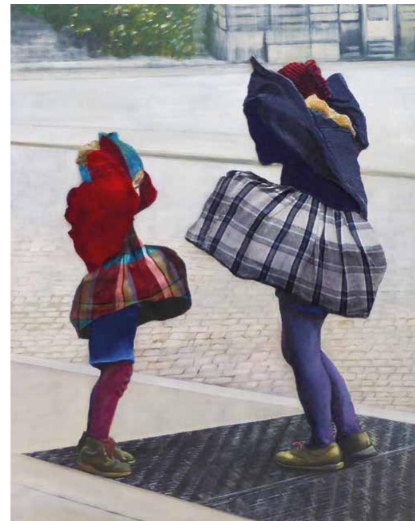
Vom Winde verweht Öl/Textil auf Leinwand · 100 x 80 cm