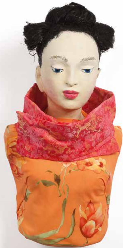
Yoko ohne Skulptur · Mischtechnik · Höhe 54 cm