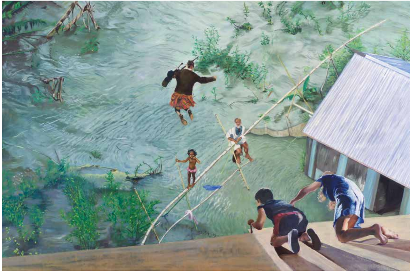
Der reisende Musiker Öl auf Leinwand · 80 x 120 cm