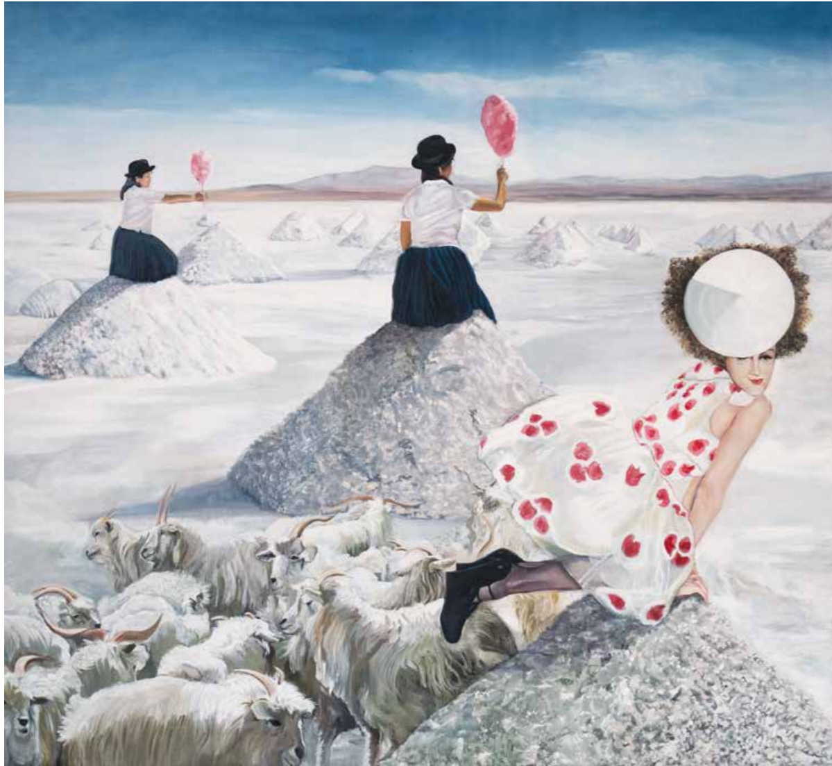
Salz und Zucker Öl auf Leinwand · 120 x 130 cm