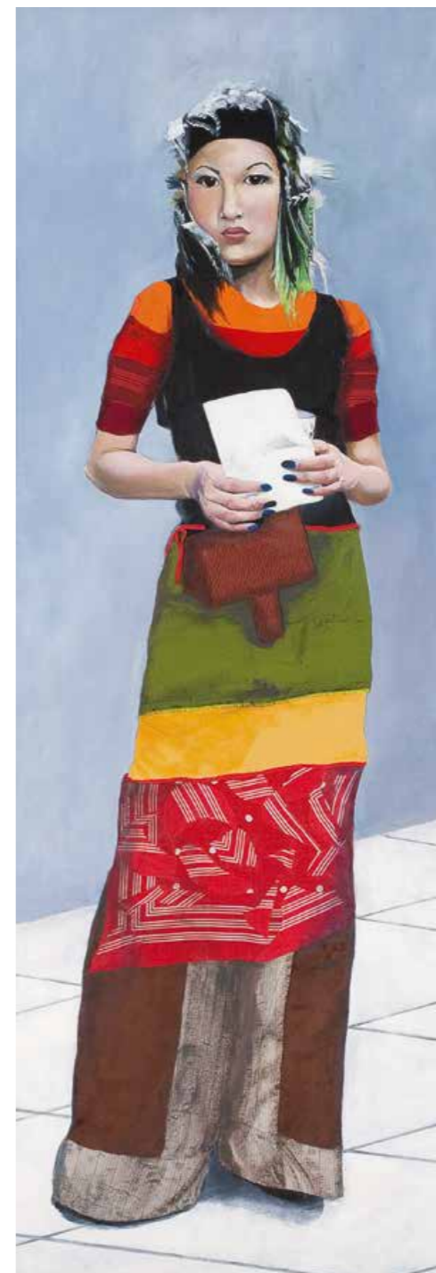
Mit Federn geschmückt Öl/Textil auf Leinwand · 145 x 50 cm