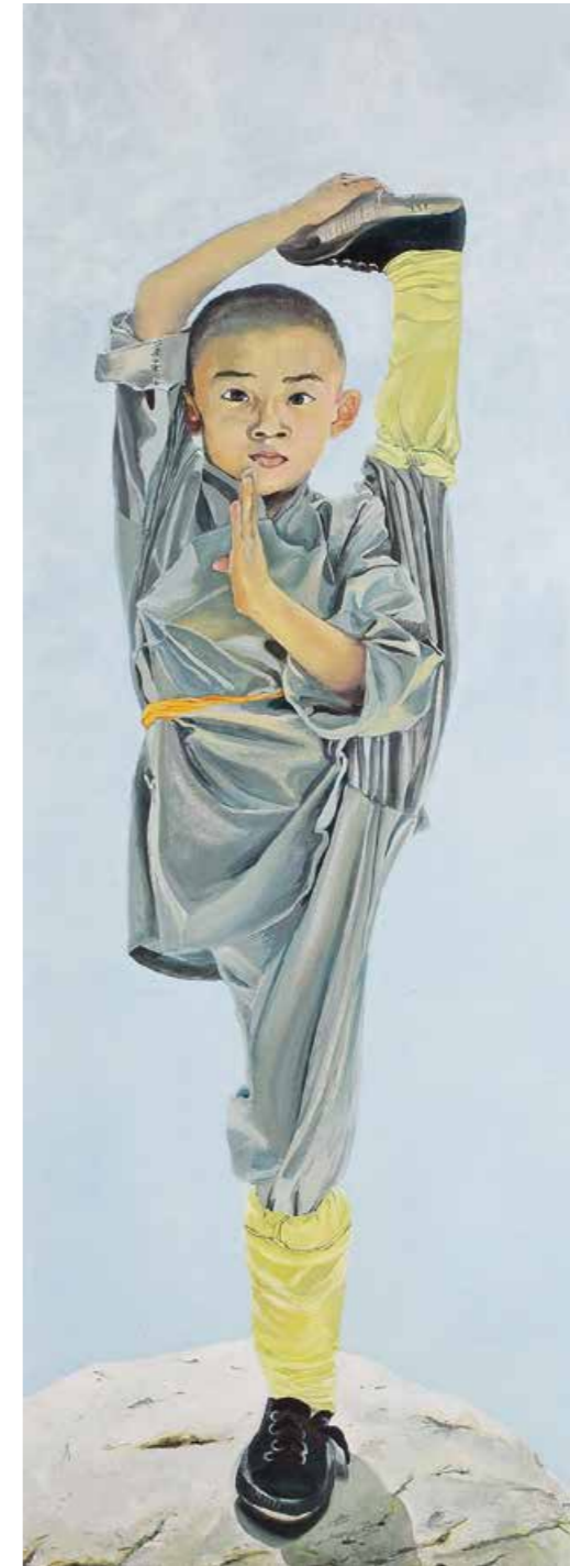
Hohe Luft Öl auf Leinwand · 130 x 40 cm