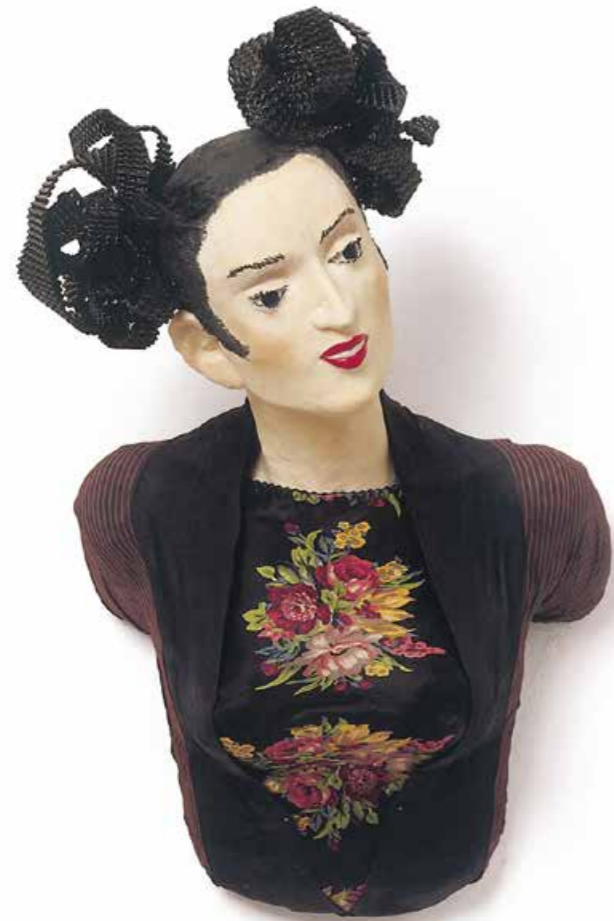
Frau Sayuri war sich ihrer Wirkung auf Männer bewusst Skulptur · Mischtechnik · Höhe 60 cm