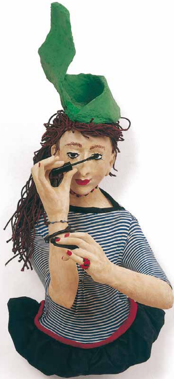
Marlene ganz allene Skulptur · Mischtechnik · Höhe 77 cm