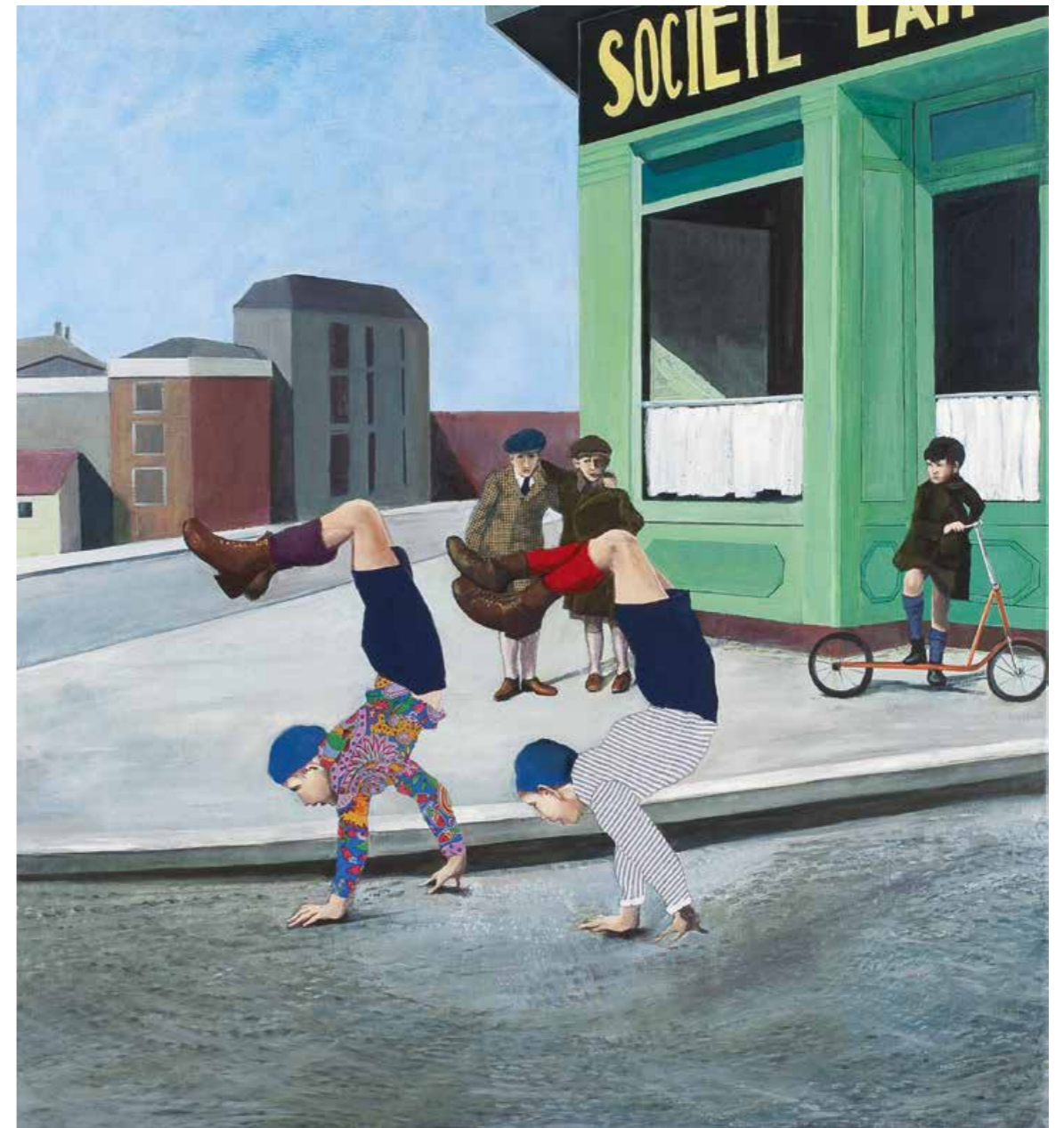
Kunst kommt von können Öl/Textil auf Leinwand · 120 x 110 cm