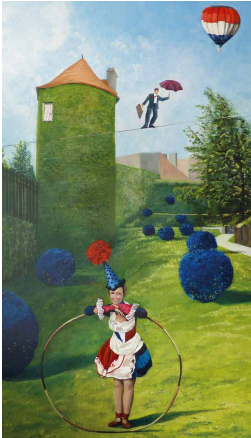
Der Privatgarten Öl auf Leinwand · 170 x 100 cm