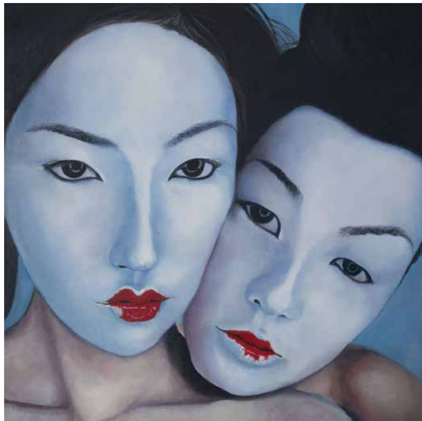
Schön & Gut Öl auf Leinwand · 60 x 60 cm