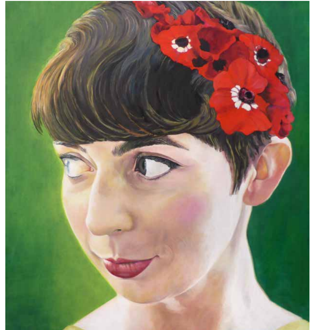
Ja, ich will Öl auf Leinwand · 120 x 110 cm