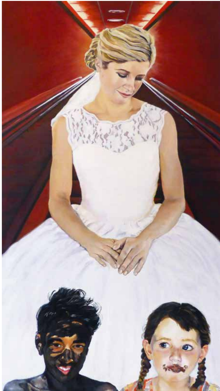
Sixtinische Rolltreppe Öl auf Leinwand · 140 x 80 cm