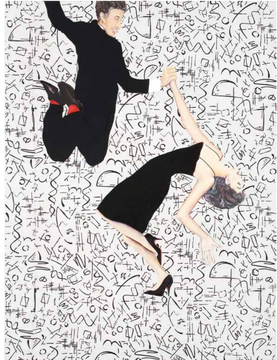
Darf ich bitten? Öl/Textil auf Leinwand · 125 x 95 cm