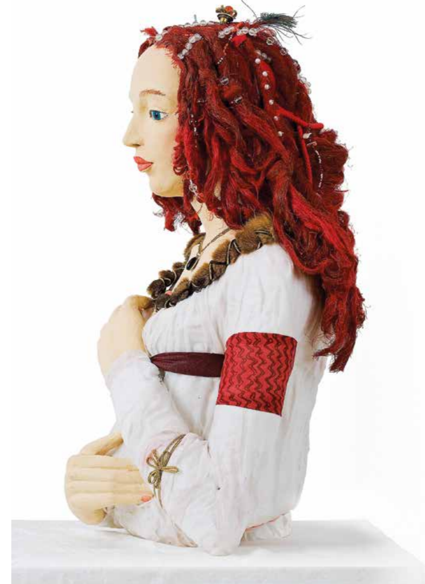
Maria Magdalena hat auch rote Haare Skulptur · Mischtechnik · Höhe 63 cm