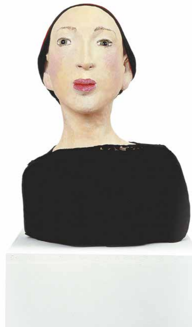
Wo ist mein Flamencopartner geblieben? Skulptur · Mischtechnik · Höhe 46 cm