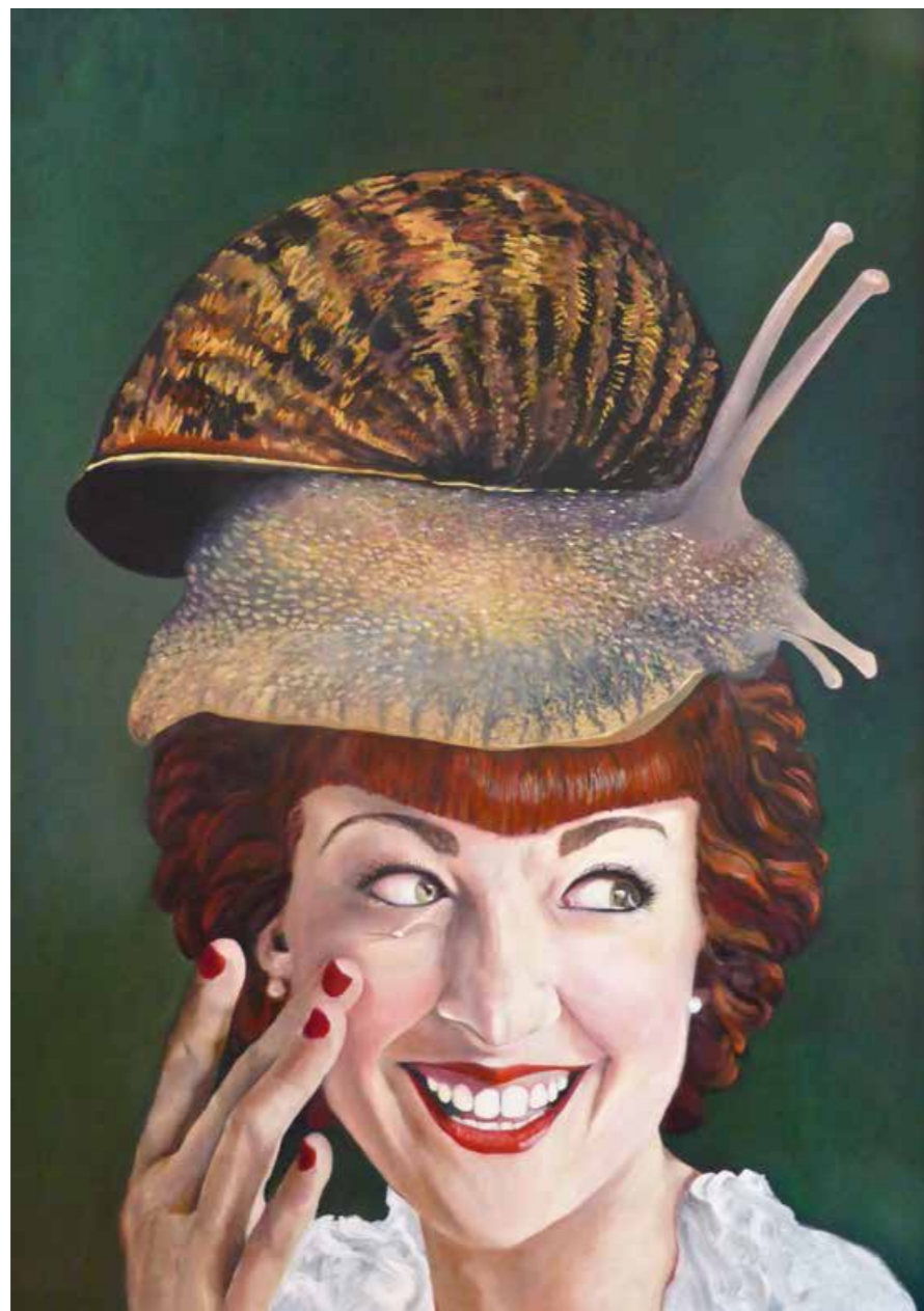
Carolina von Schneckenbrot Öl auf Leinwand · 120 x 85 cm