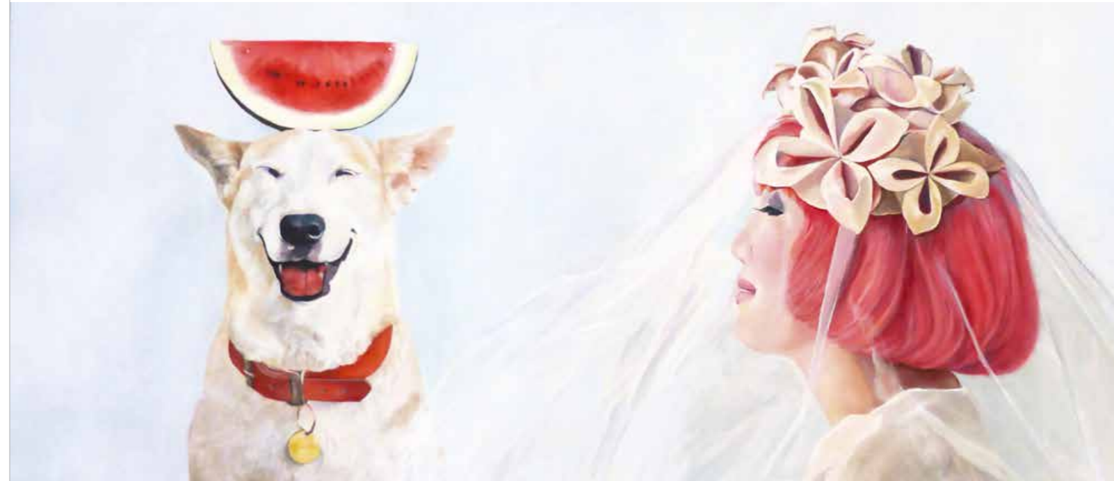
Wollen wir tauschen? Öl auf Leinwand · 85 x 190 cm