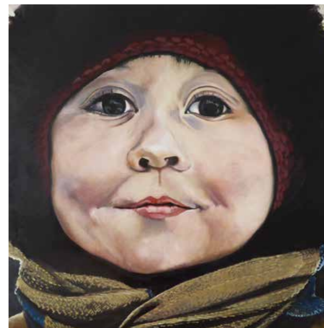
Vier in Murmansk Öl auf Leinwand · 60 x 60 cm