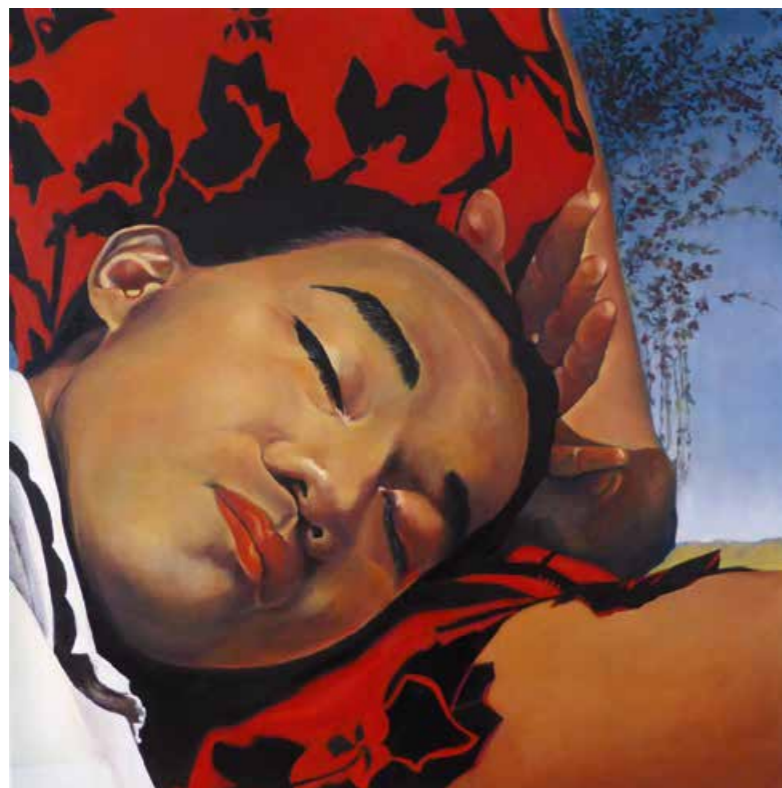
Das rote Sommerkissen Öl auf Leinwand · 50 x 50 cm