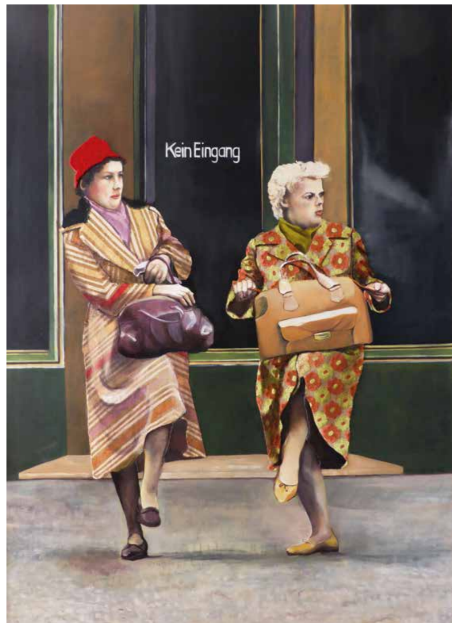
Flamingos im Winter Öl/Textil auf Leinwand · 125 x 90 cm