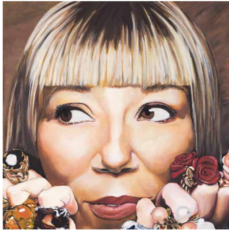
Daisy zeigt ihre Ringe Öl auf Leinwand · 60 x 60 cm