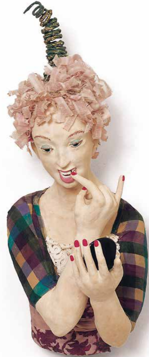
Petersilie, wo denn? Skulptur · Mischtechnik · Höhe 68 cm