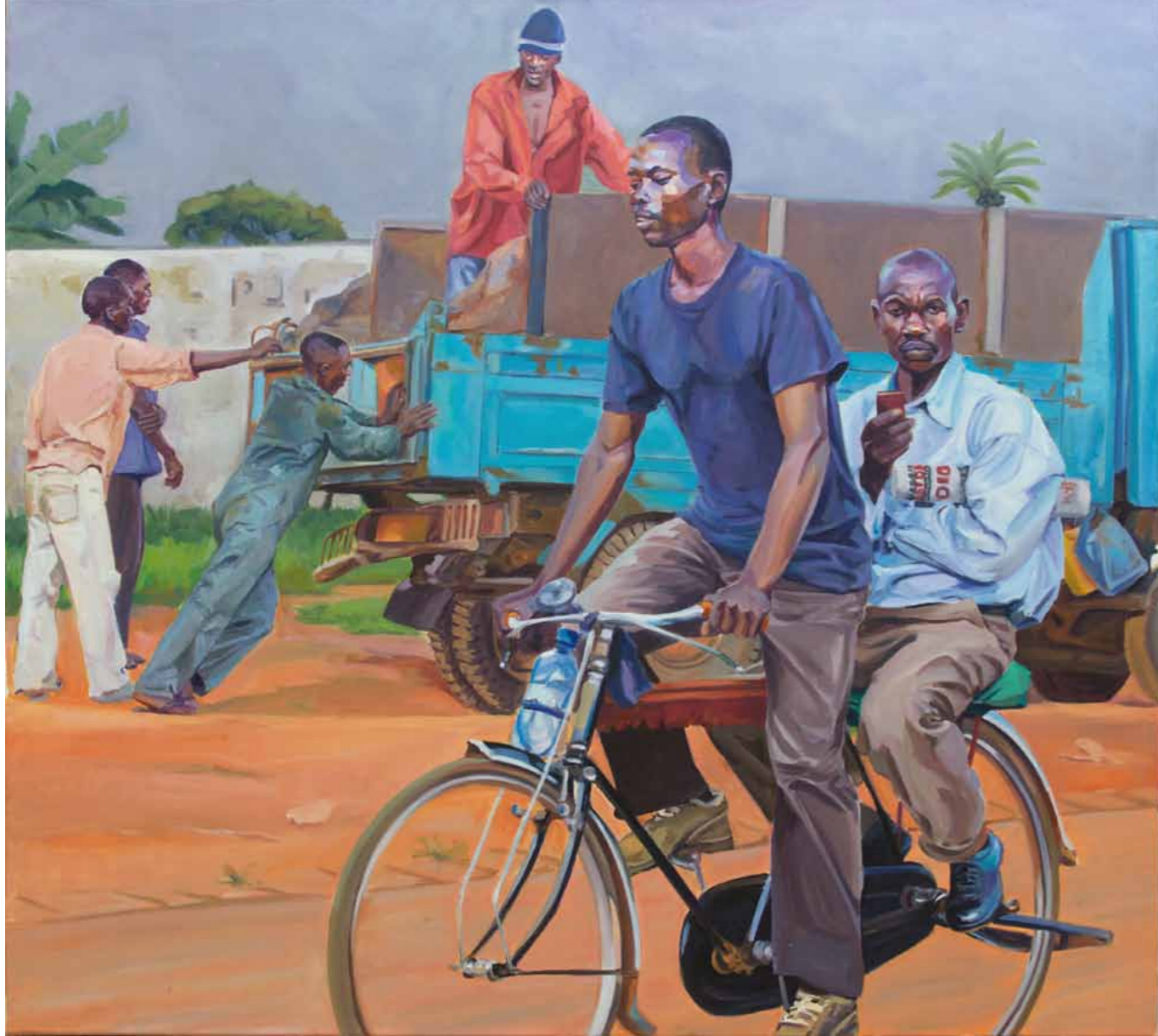
Claudia Wirth Uganda 3 2013 · Öl auf Leinwand · 95 x 105 cm