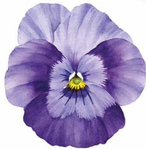
Tania Engelke Kleine Holzblüten

2010-2013 · Aquarell, Büttchen auf Holz, ca. 15 x 15 cm