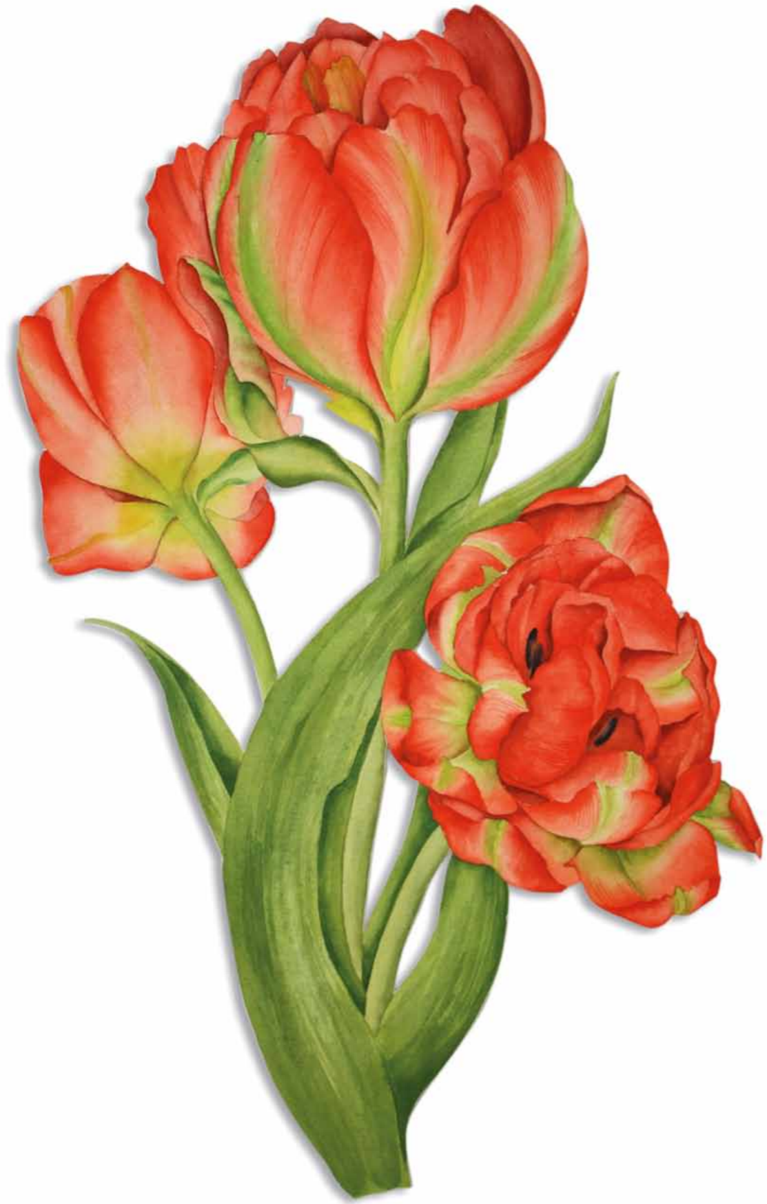
Tania Engelke Durch die Blume · Tulpe

2009 · Aquarell · Büttchen auf Holz · ca. 60 x 30 cm