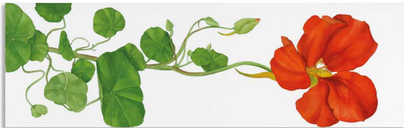
Tania Engelke Liegende Kresse · gelb / Liegende Kresse · orange

2007 · Aquarell · Büttchen auf Keilrahmen · 25 x 80 cm