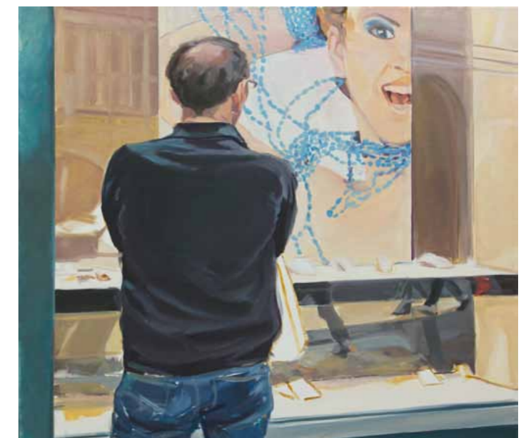
Claudia Wirth Umworben 1-3 2009 · Öl auf Leinwand · je 75 x 80 cm cm