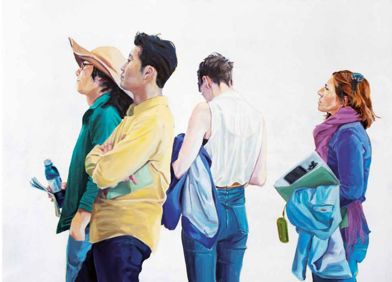
Claudia Wirth Wartende 1 2013 · Öl auf Leinwand · 100 x 140 cm