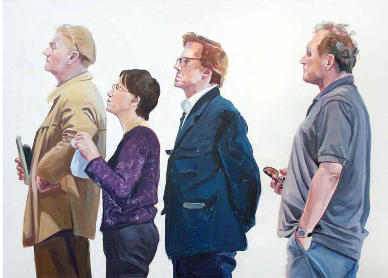
Claudia Wirth Wartende 4 2013 · Öl auf Leinwand · 100 x 140 cm