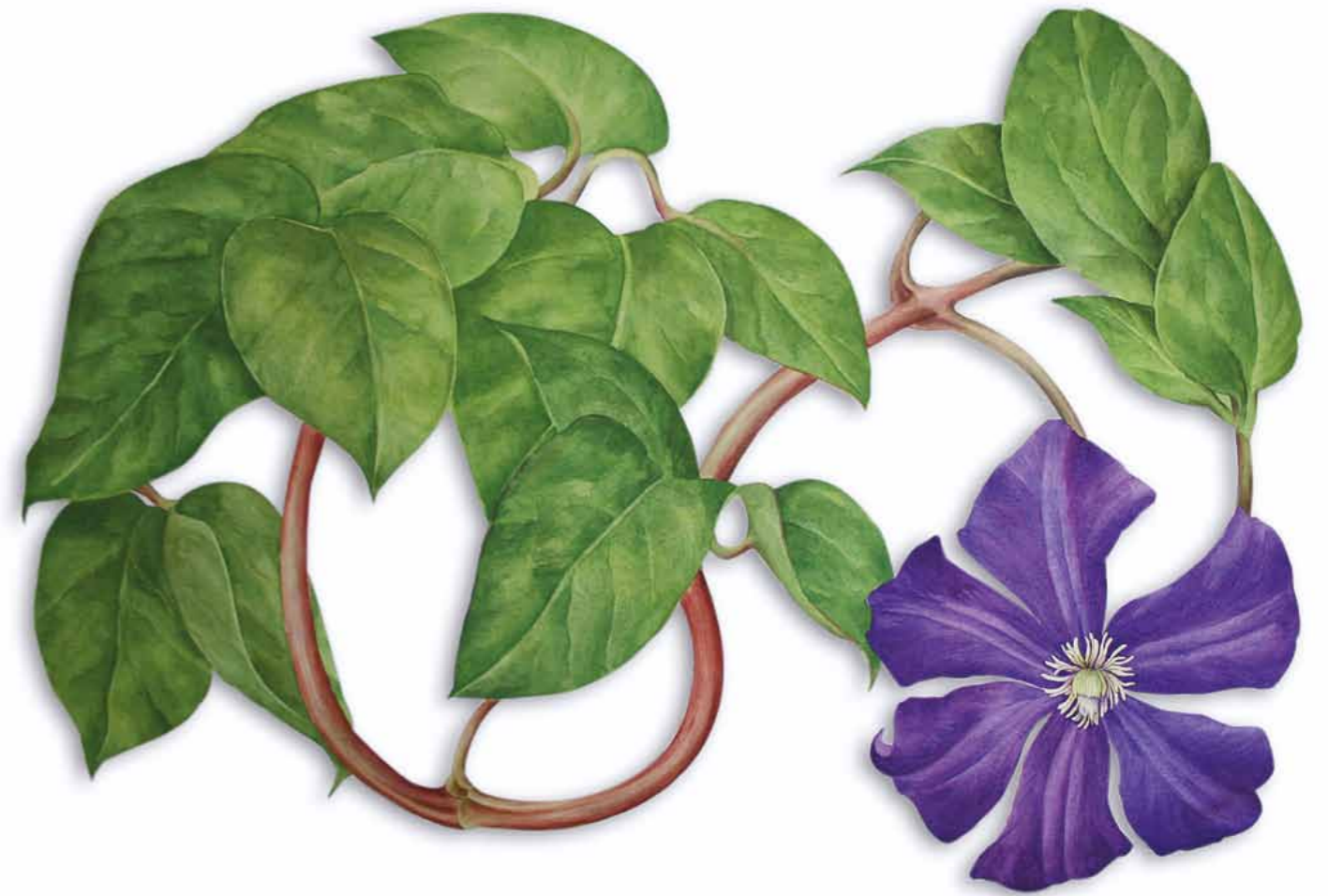
Tania Engelke Clematis

Einzelblüte aus der 3-teiligen Installation · 2011 · Aquarell auf 600 g Bütten · ca. 60 x 80 cm