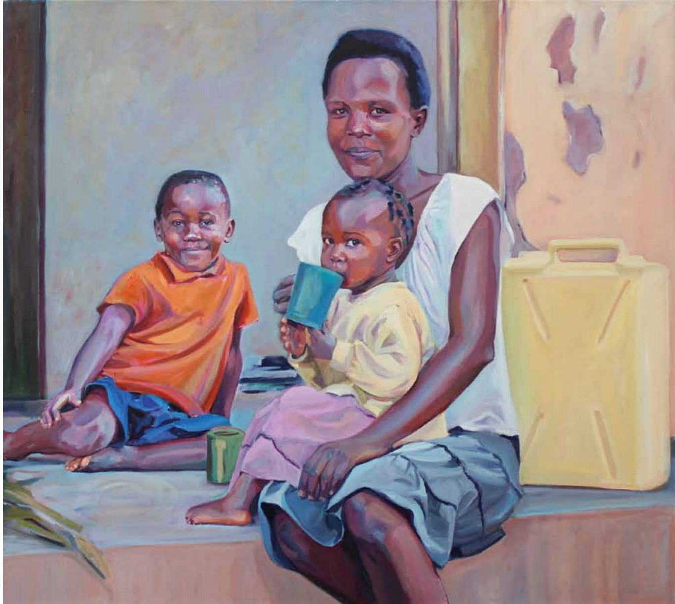
Claudia Wirth Uganda 1 2013 · Öl auf Leinwand · 95 x 105 cm