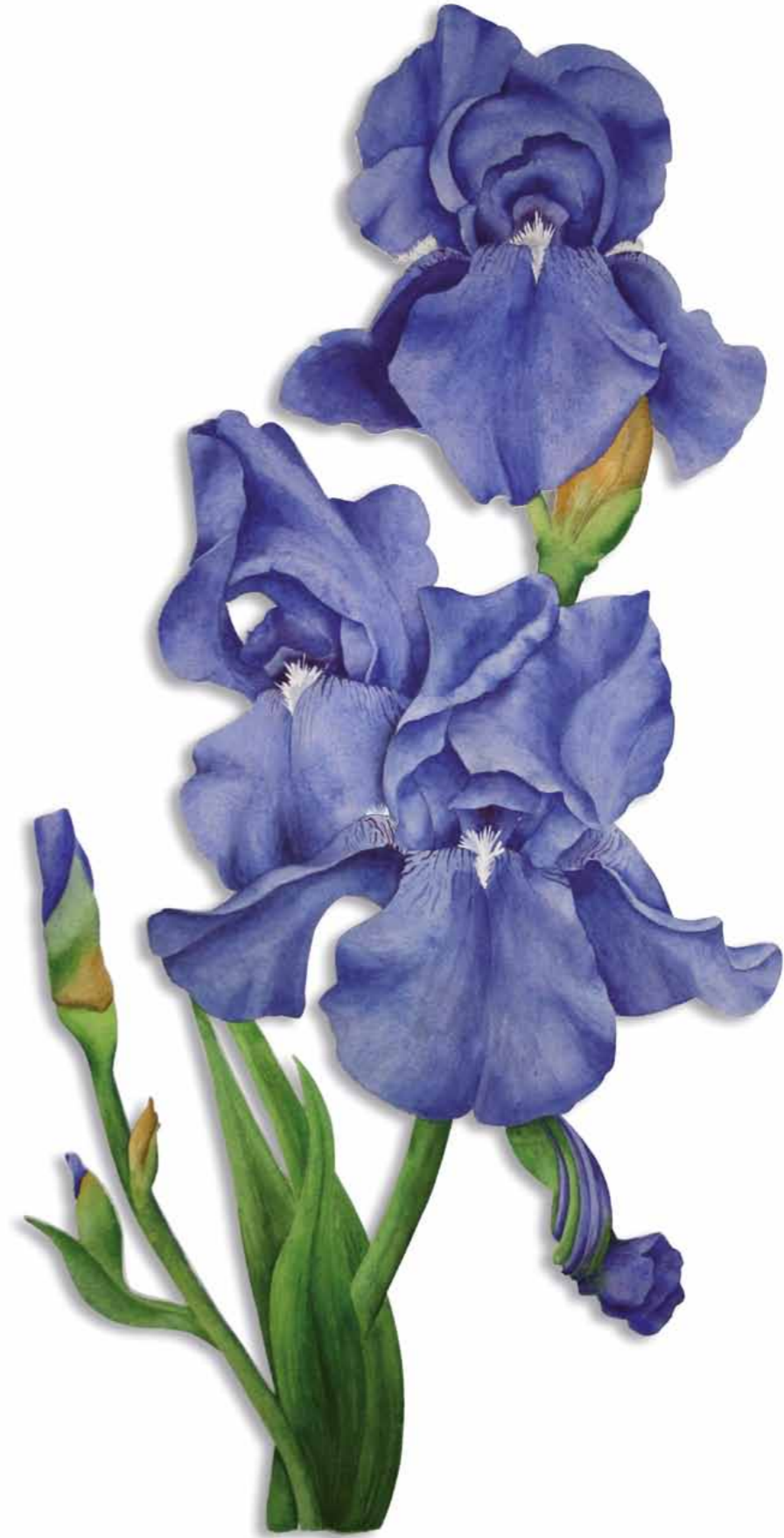
Tania Engelke Durch die Blume · Iris

2009 · Aquarell · Büttchen auf Holz · ca. 60 x 30 cm