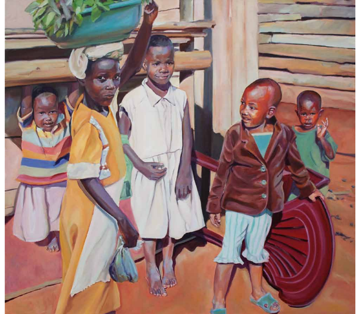
Claudia Wirth Uganda 4 2013 · Öl auf Leinwand · 95 x 105 cm