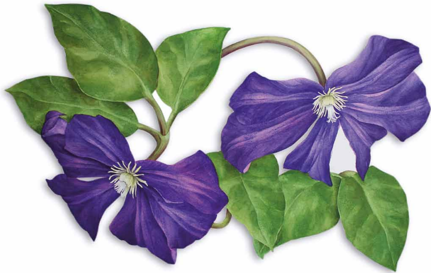
Tania Engelke Clematis

Einzelblüte aus der 3-teiligen Installation · 2011 · Aquarell auf 600 g Bütten · ca. 60 x 80 cm