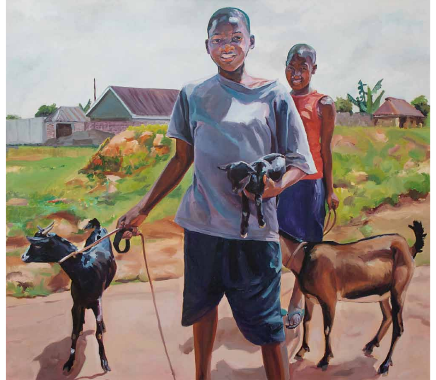
Claudia Wirth Uganda 2 2013 · Öl auf Leinwand · 95 x 105 cm