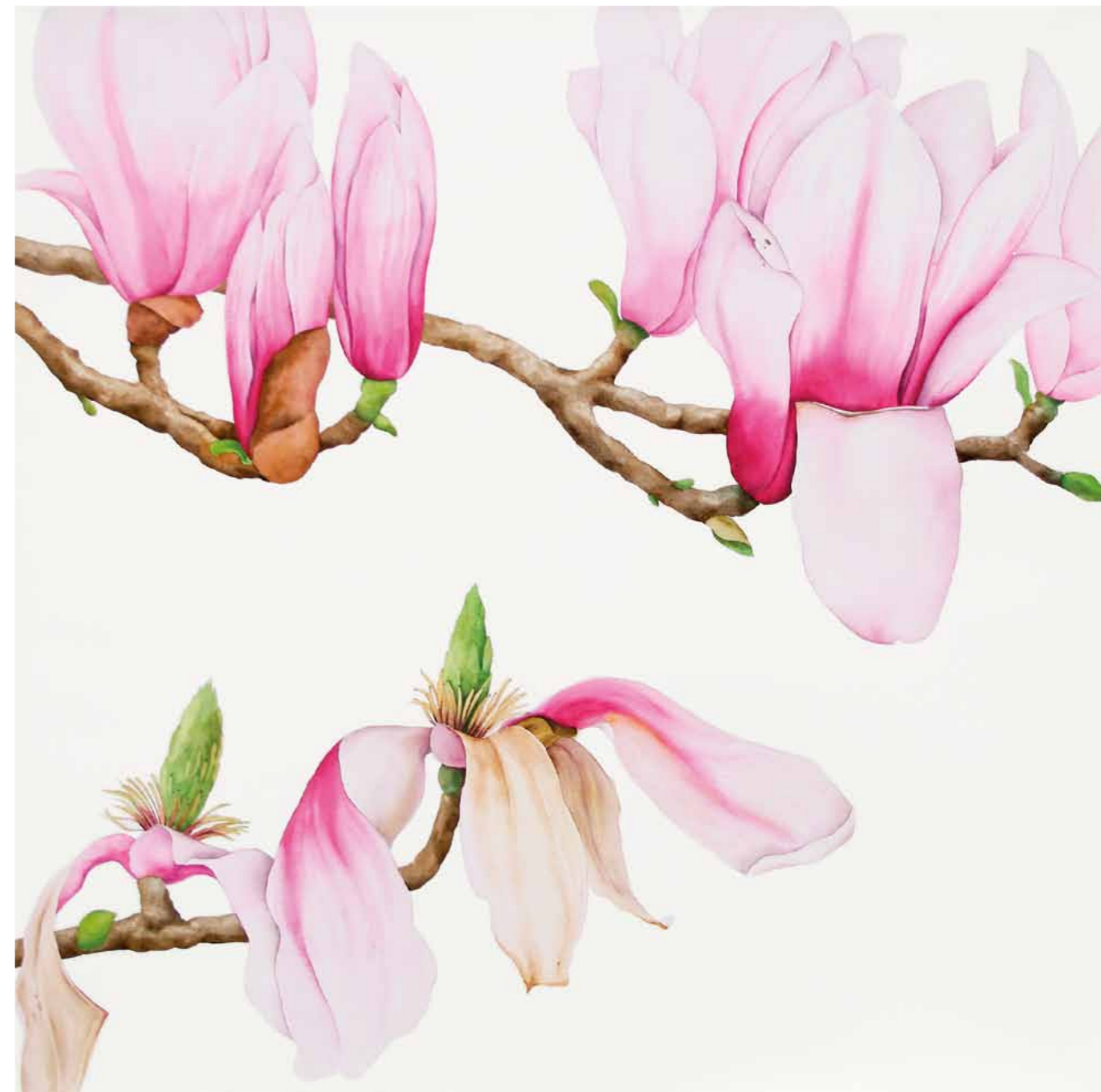
Tania Engelke Magnolien

2007 · Aquarell · Büttchen auf Keilrahmen · 25 x 80 cm