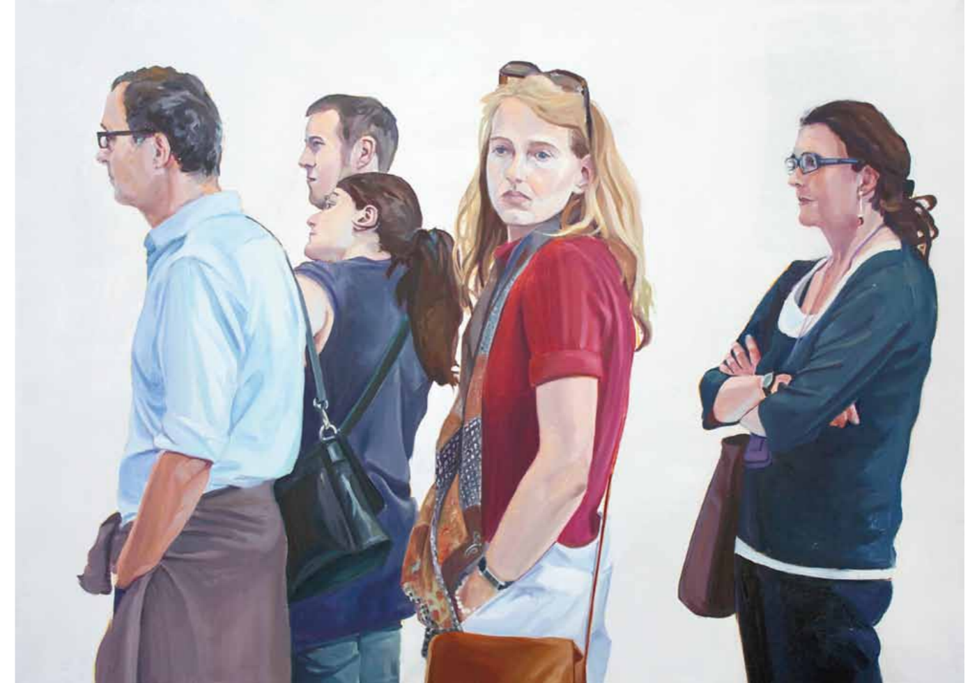
Claudia Wirth Wartende 3 2013 · Öl auf Leinwand · 100 x 140 cm