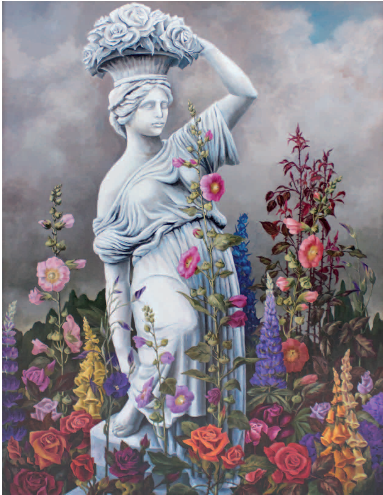
Die Winzerin vom Kaiserplatz 1995 · Öl auf Leinwand · 130 x 100 cm