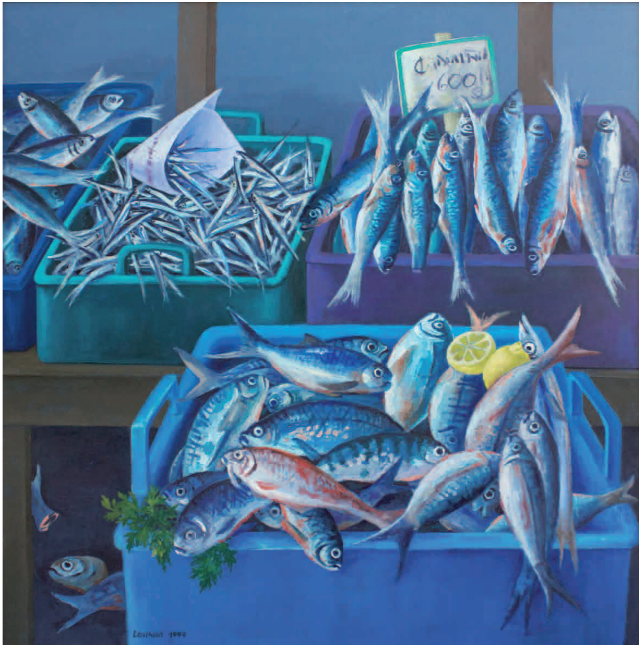
Fischmarkt 1999 · Öl auf Leinwand · 100 x 73 cm