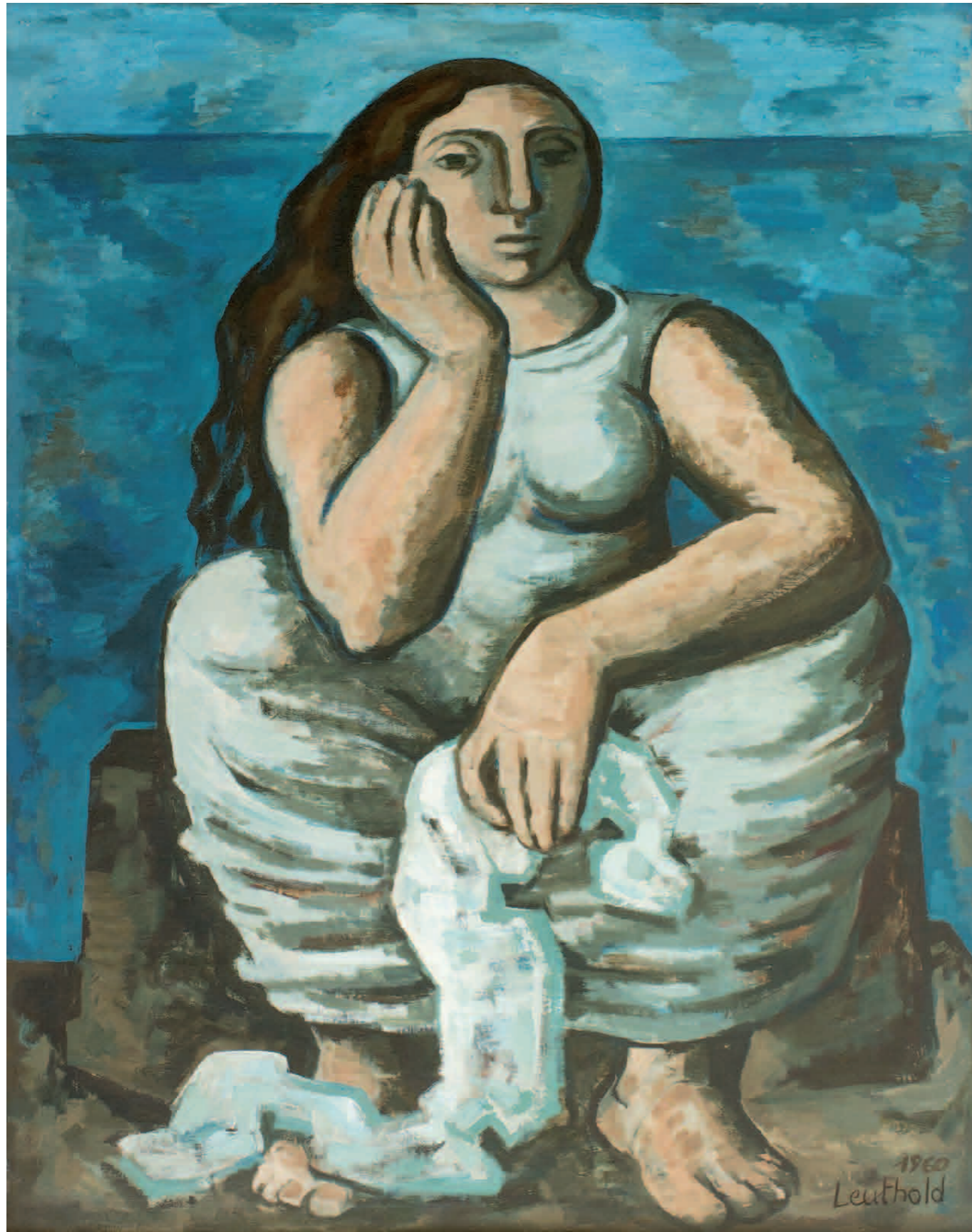
Hockende Frau 1960 · Öl auf Leinwand · 100 x 80 cm