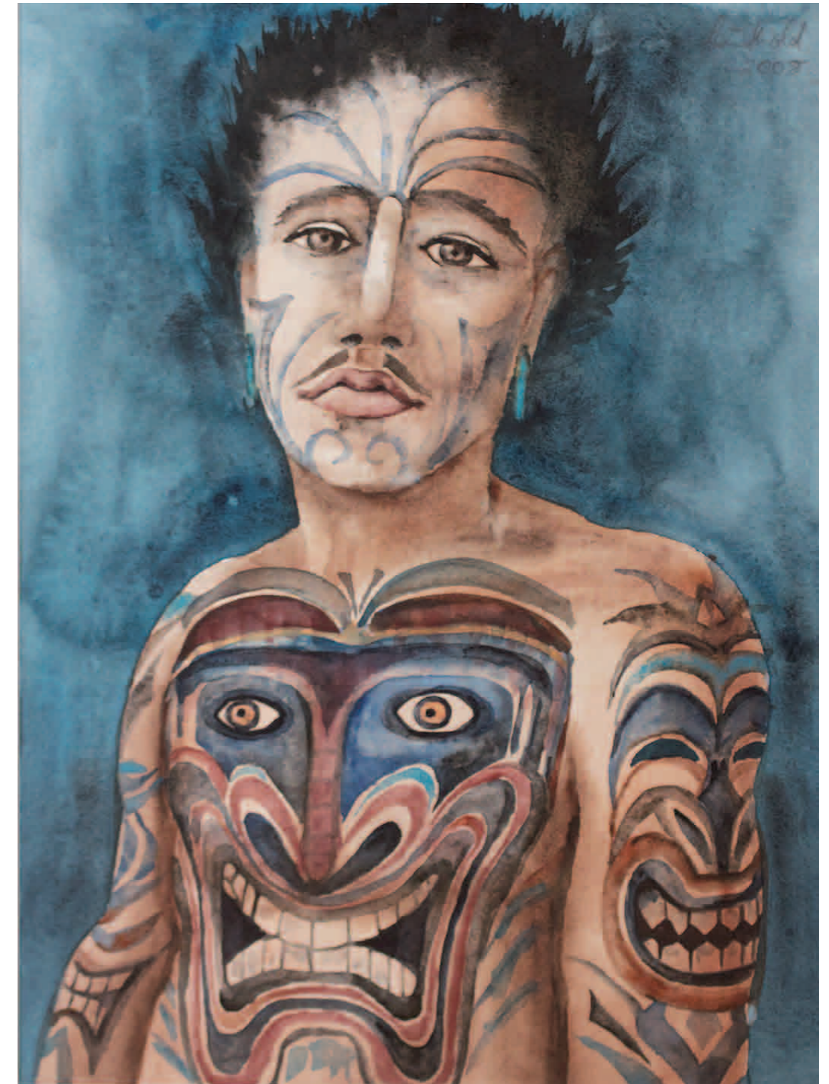
Vorkolumbianische Masken 2008 · Aquarell · 47,5 x 36 cm