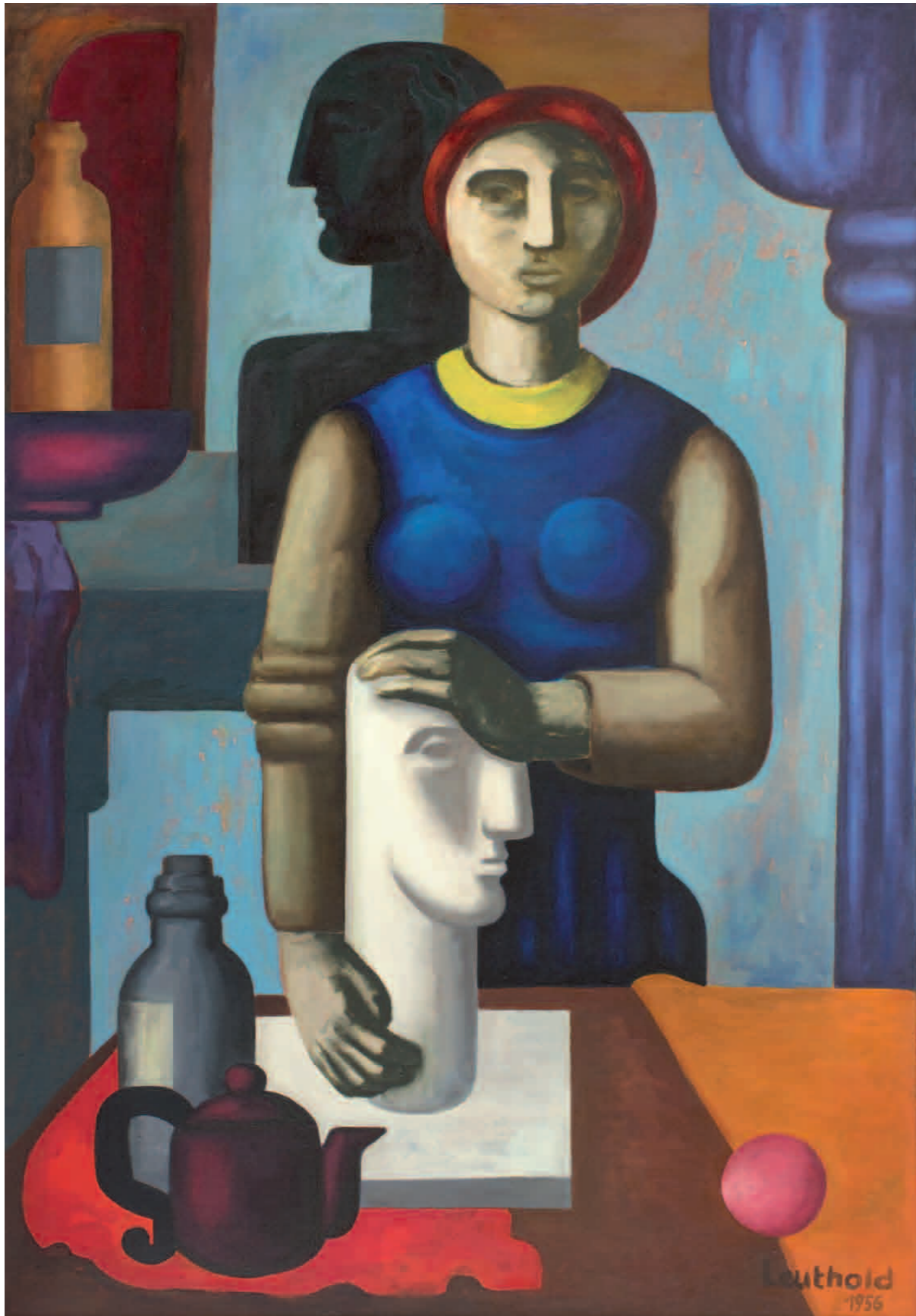
Frau mit Gipsfigur 1956 · Öl auf Leinwand · 131 x 90 cm