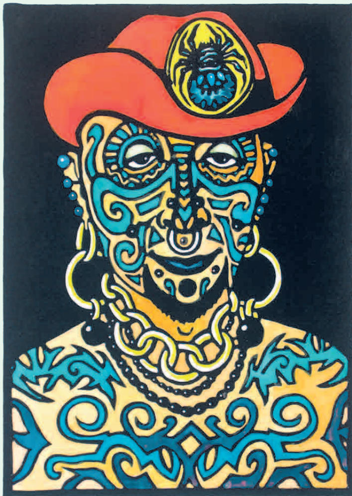
Der rote Hut