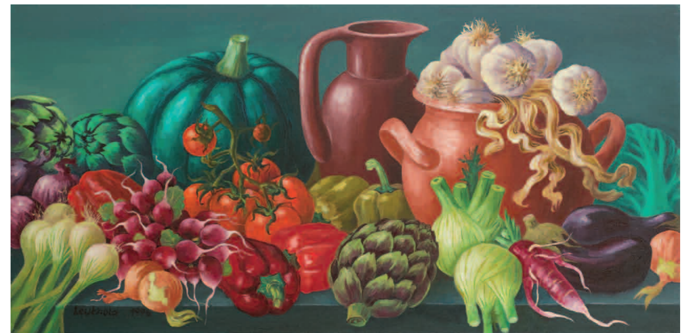
Südfrüchte · Stilleben mit Gemüse und Krügen 1996 · Öl auf Leinwand · je 50 x 100 cm