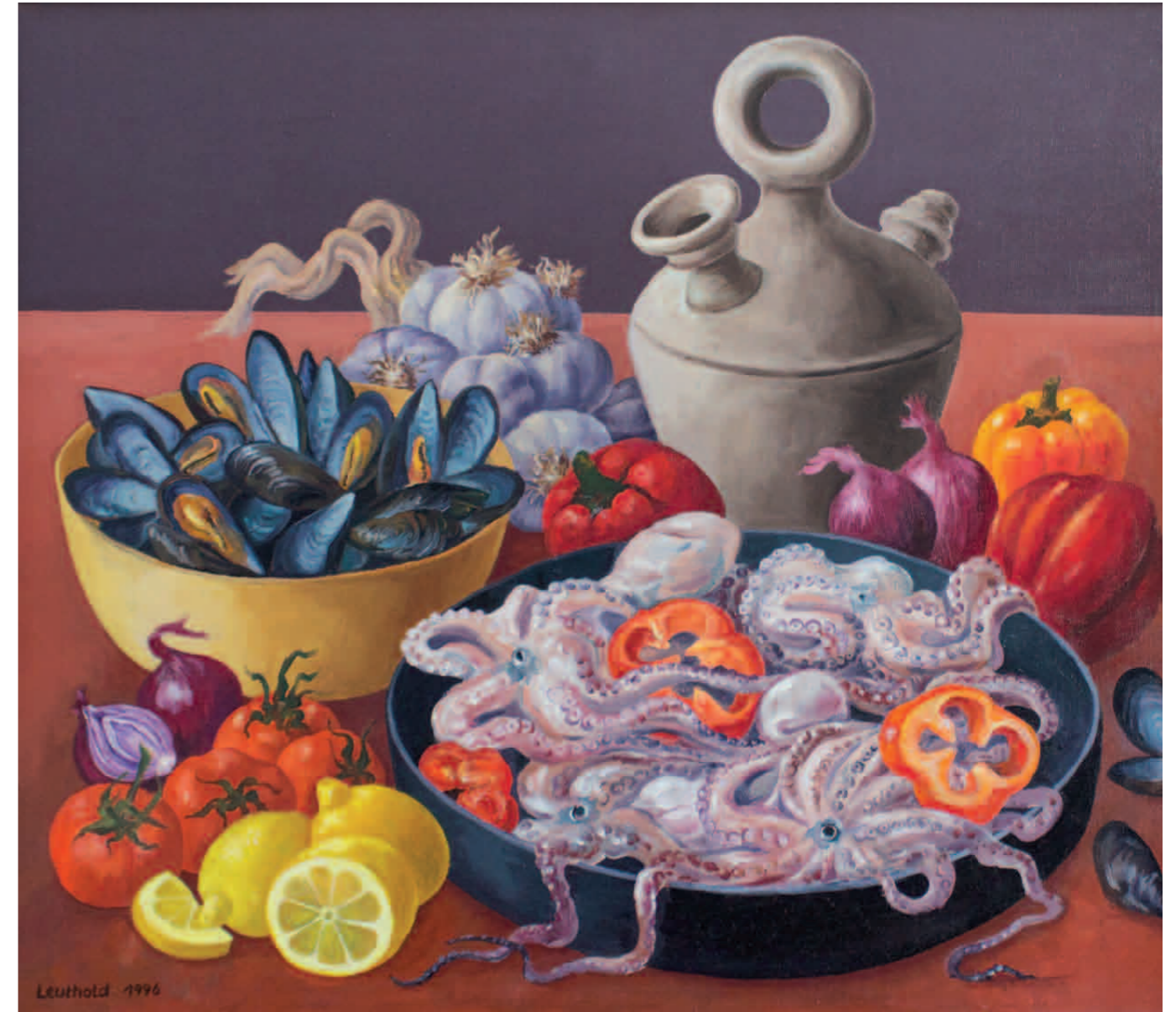
Tintenfische und Muscheln 1996 · Öl auf Leinwand · 70 x 80 cm