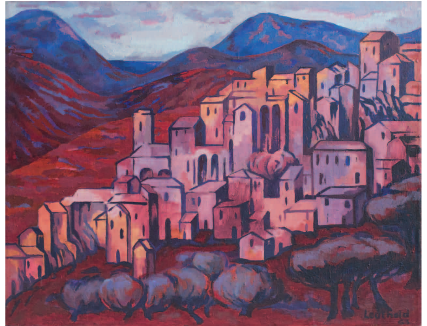
Olevano Romano 1963 · Öl auf Leinwand · 70 x 90 cm