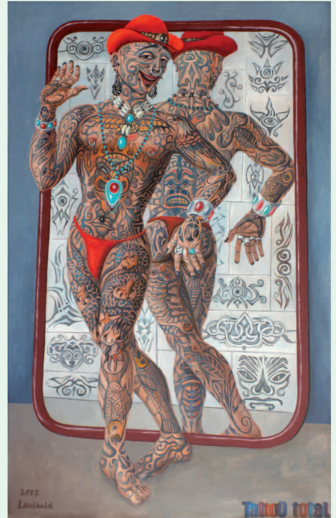
Tattoo total 2007 · Öl auf Leinwand · 160 x 100 cm

Glasmosaiken: Lynarschule, Grundschule am Weimeisterhornweg, Oberschule Alt-Marienfelde, Grundschule Körtingstraße, Behinderten-Tagesstätte Selbuschring, Heilpädagogisches Zentrum Talbergstraße, Kindertagesstätte für deutsche und türkische Kinder Ebersstraße, Seniorenfreizeitstätte Hanielweg, Kindertagesstätte Ringbahnstraße, (alle Berlin).