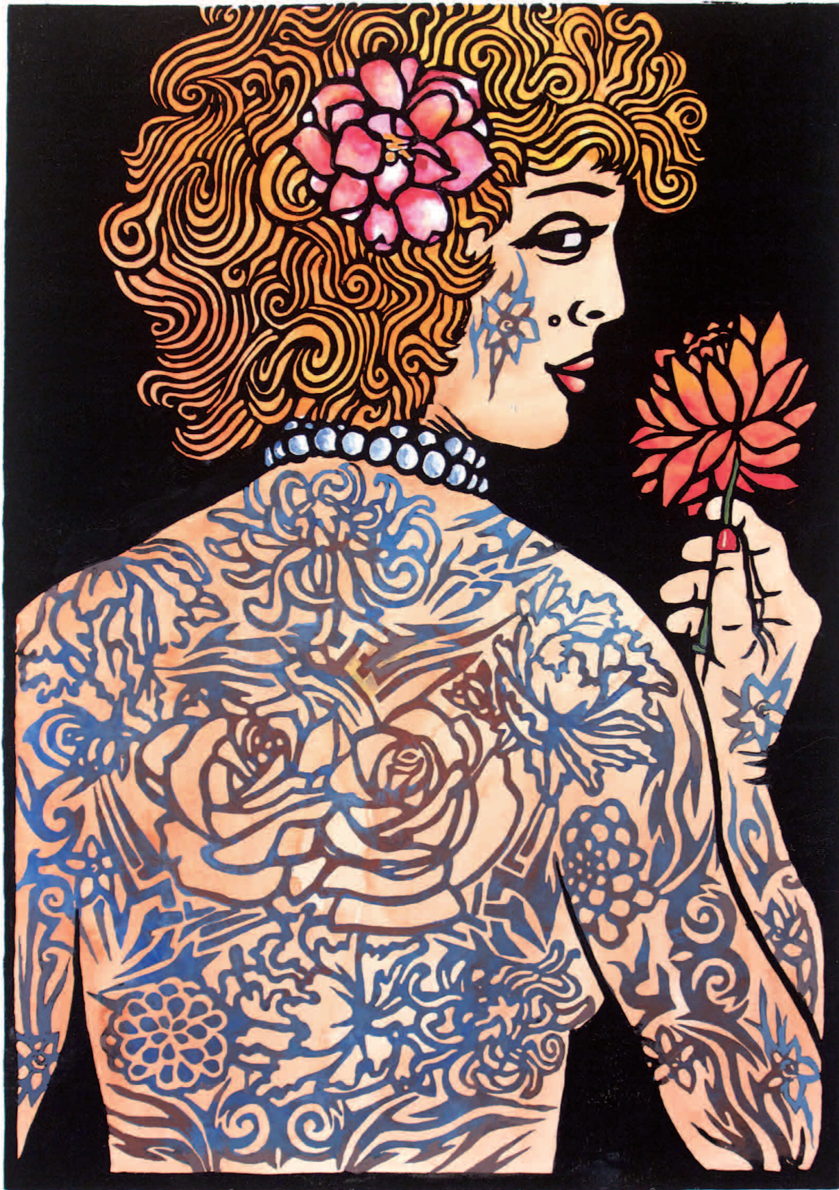
Blumen und Tribals

2008 · Linolschnitt mit Aquarell untermalt · 64 x 50 cm