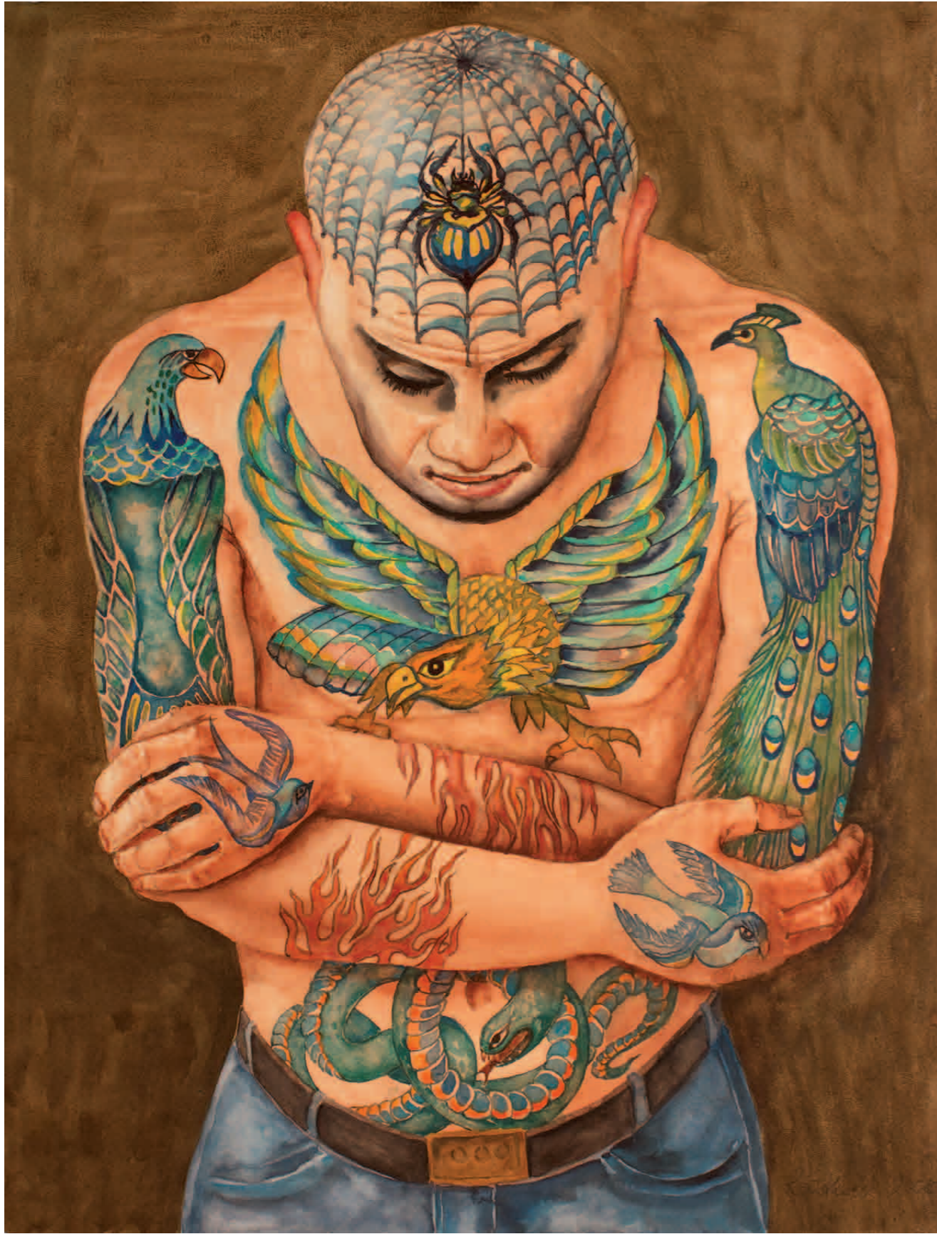
Spinnennetz und Vögel 2008 · Aquarell · 64 x 50 cm