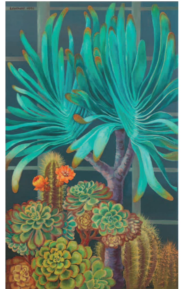
Kakteen-Gewächshaus I-III 1996 · Öl auf Leinwand · je 100 x 60 cm