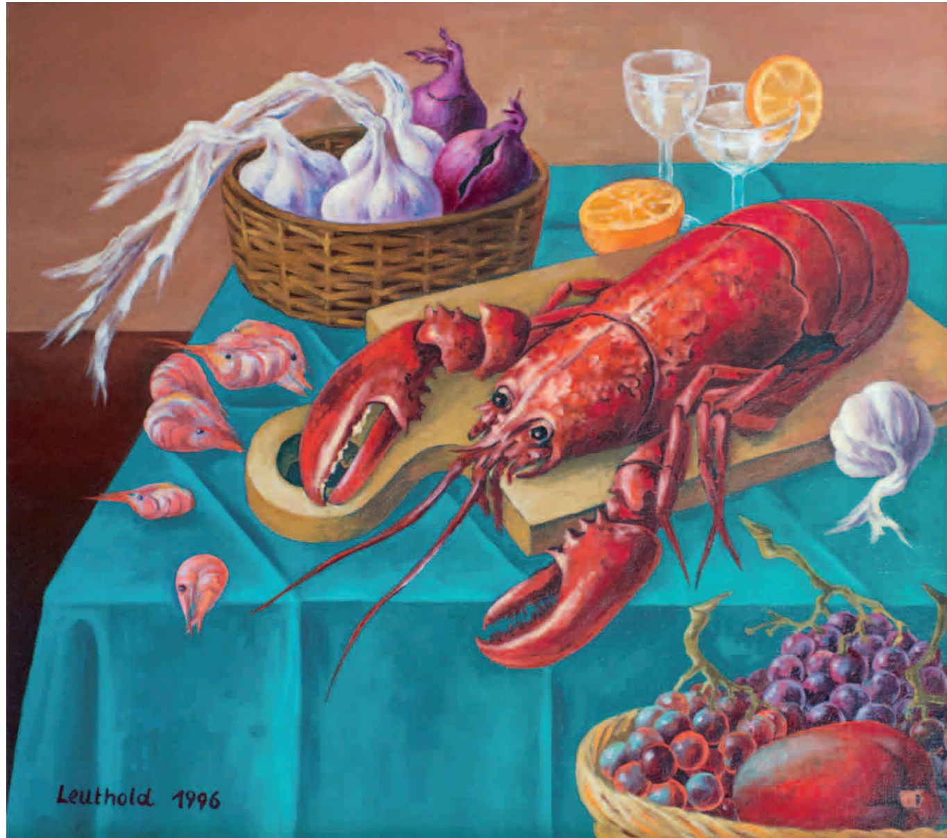
Der Riesenhummer 1996 · Öl auf Leinwand · 70 x 80 cm