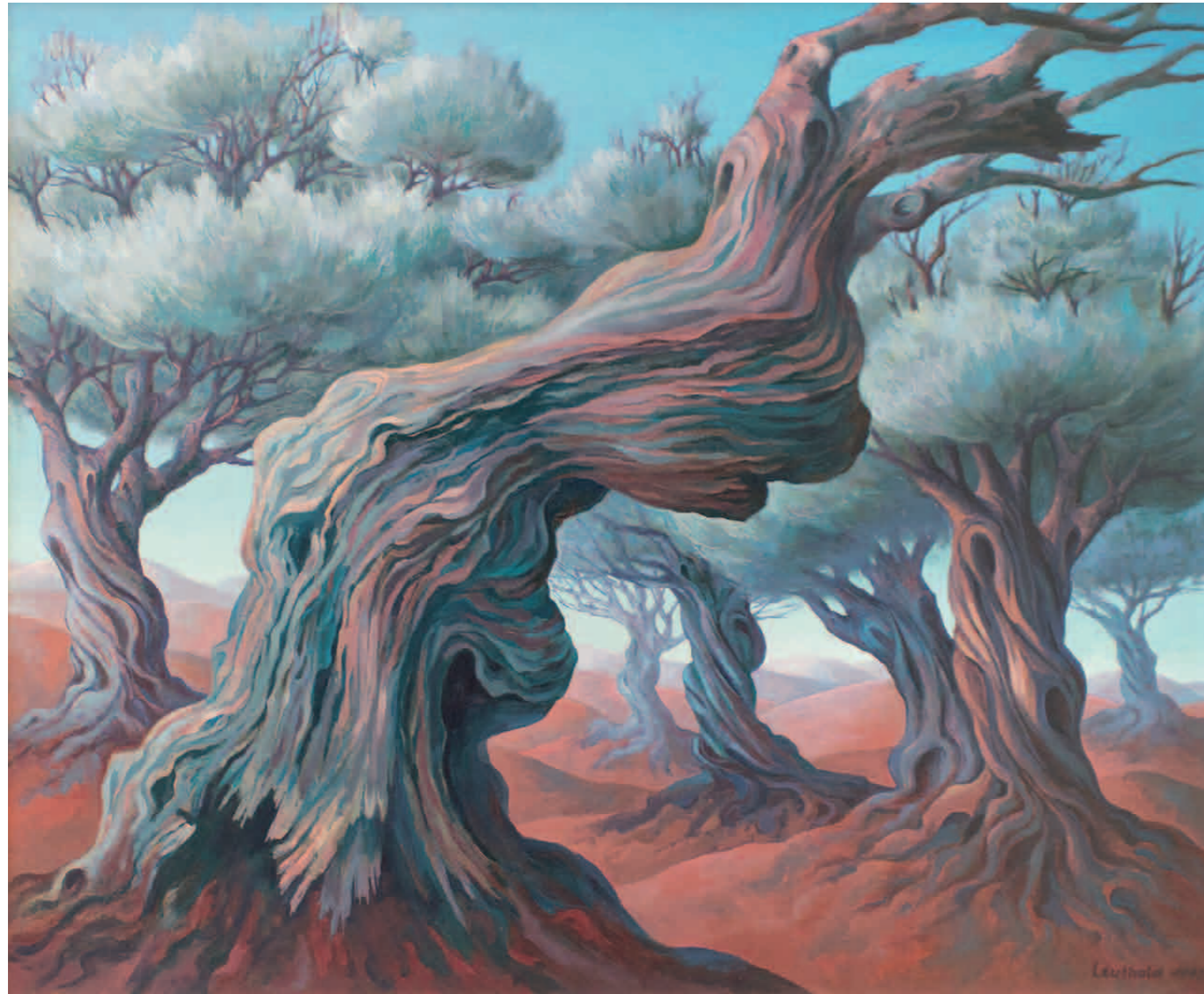
Toter Ölbaum 1992 · Öl auf Leinwand · 100 x 120 cm