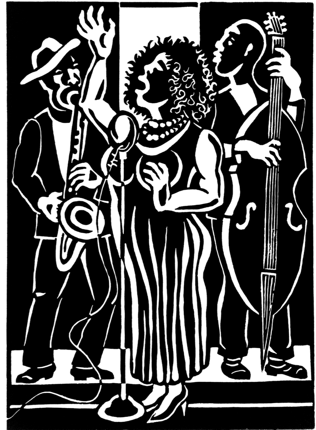
Gospelsängerin 2006 · Linolschnitt · 46 x 35 cm