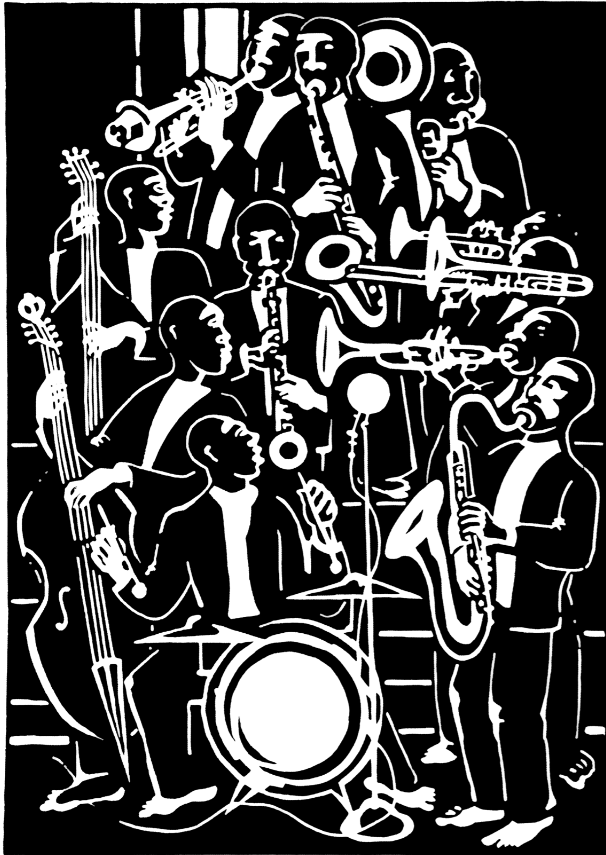
Dream Orchestra 2001 · Linolschnitt · 60 x 42 cm