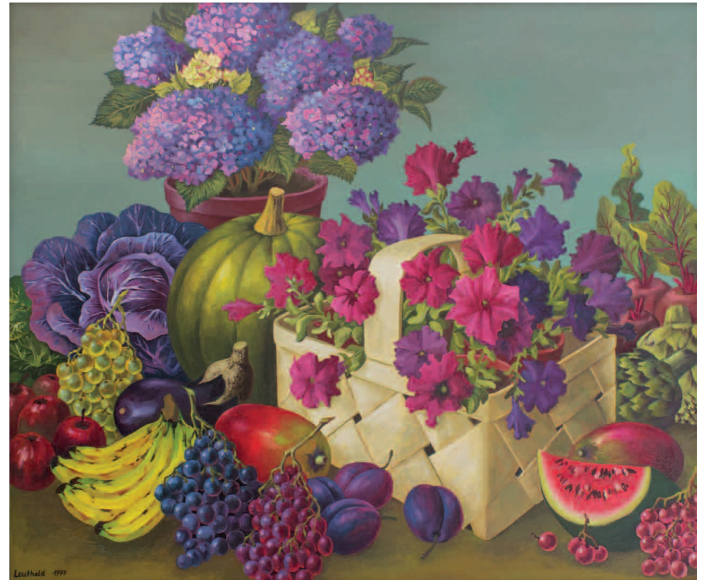
Stilleben mit Korb und Blumen 1997 · Öl auf Leinwand · 100 x 120 cm