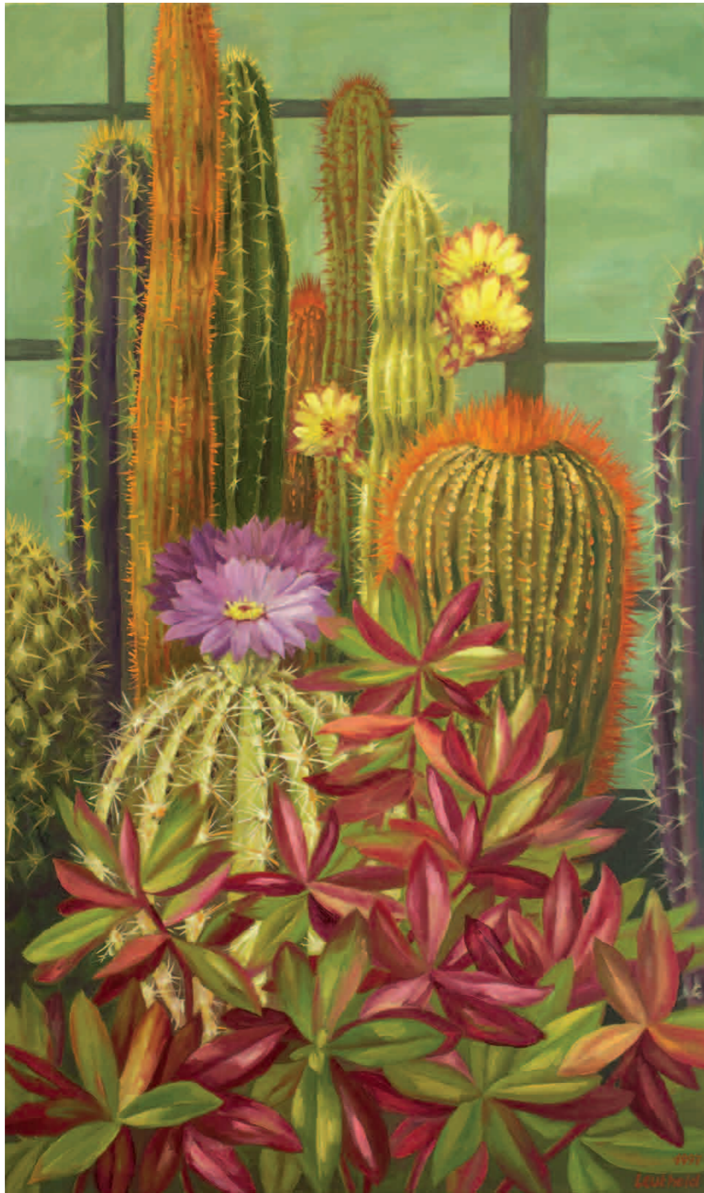
Kakteen-Gewächshaus IV 1997 · Öl auf Leinwand · 100 x 60 cm