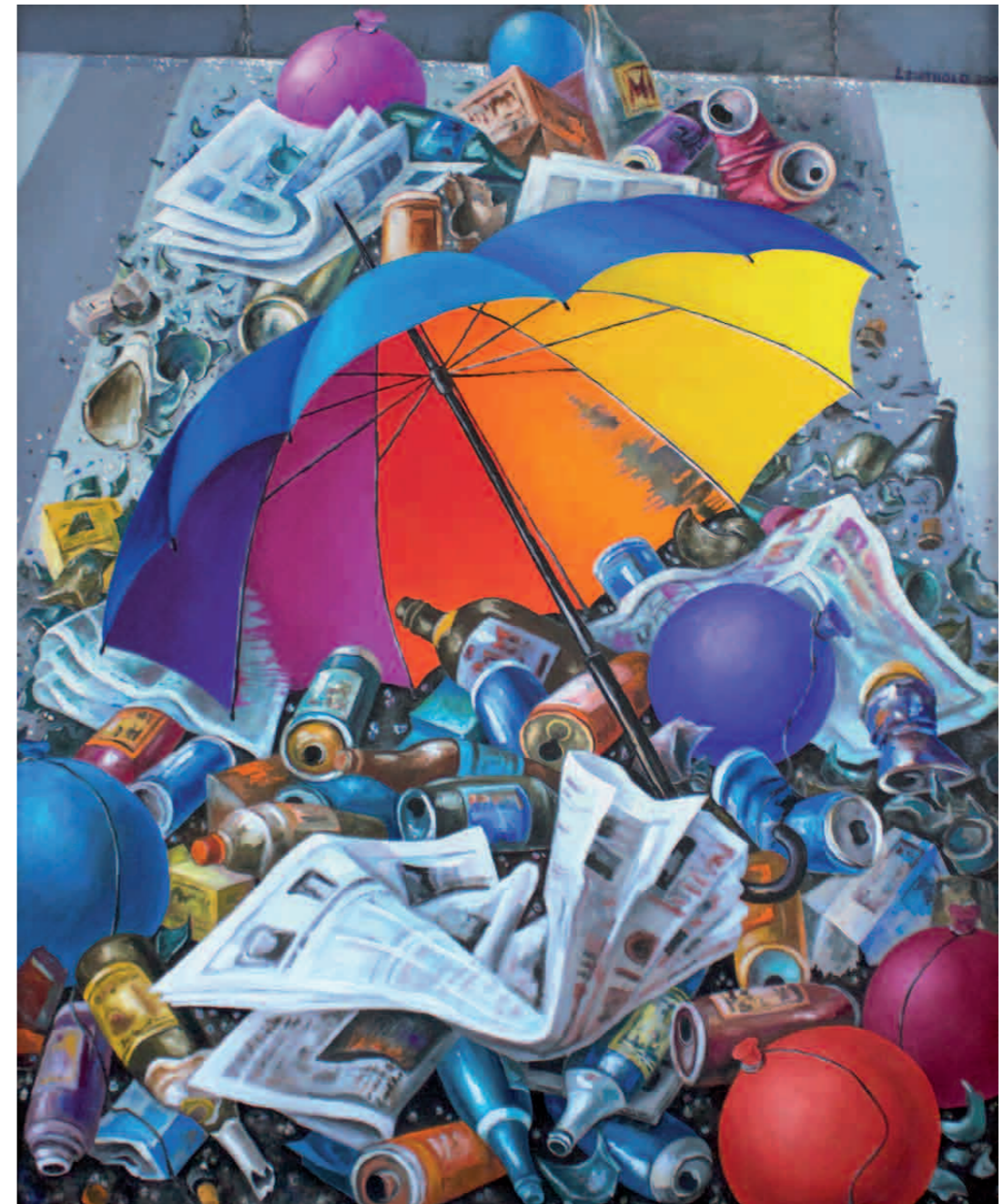
Parademüll 2006 · Öl auf Leinen · 135 x 110 cm