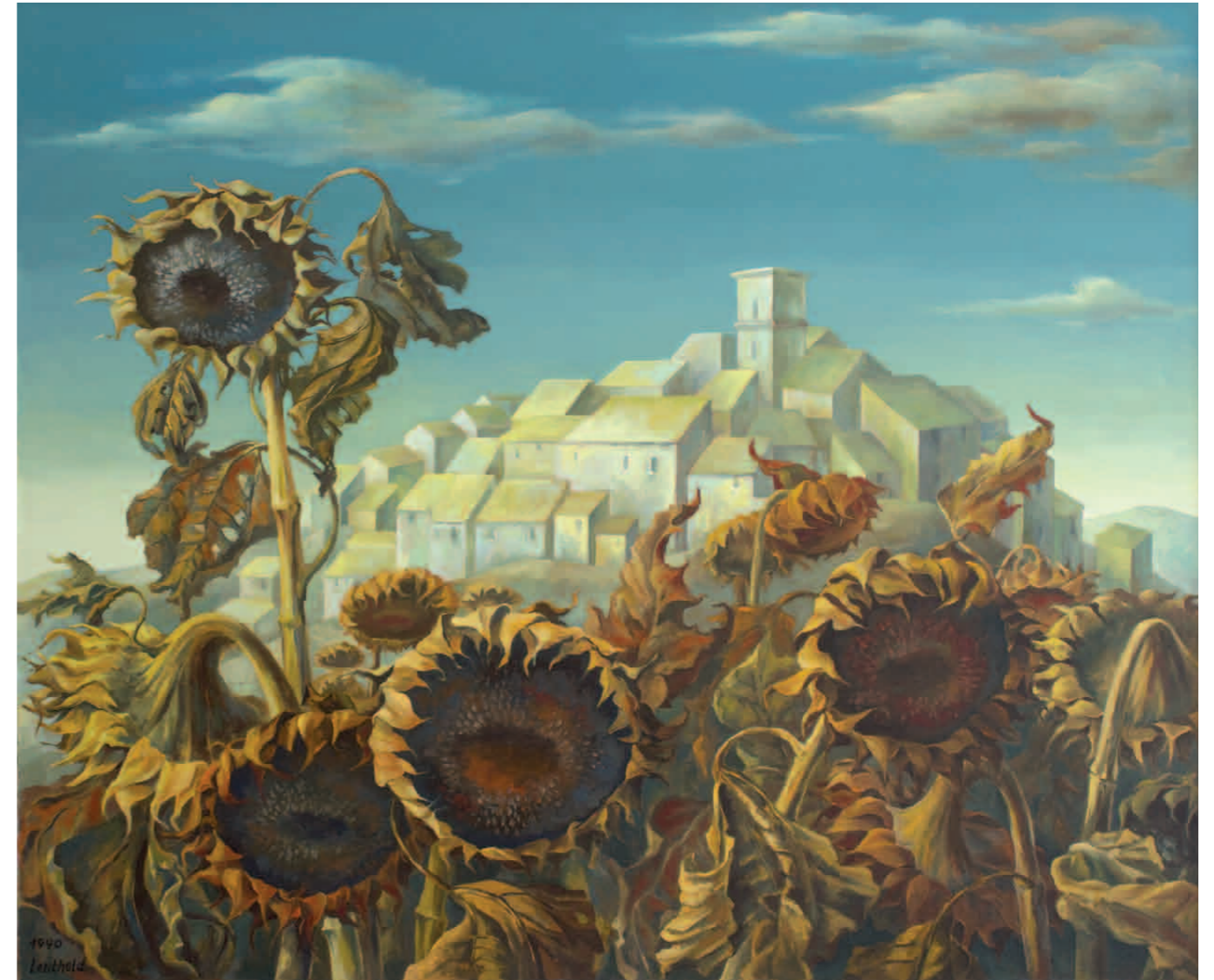
Il mezzo giorno 1990 · Öl auf Leinwand · 100 x 120 cm