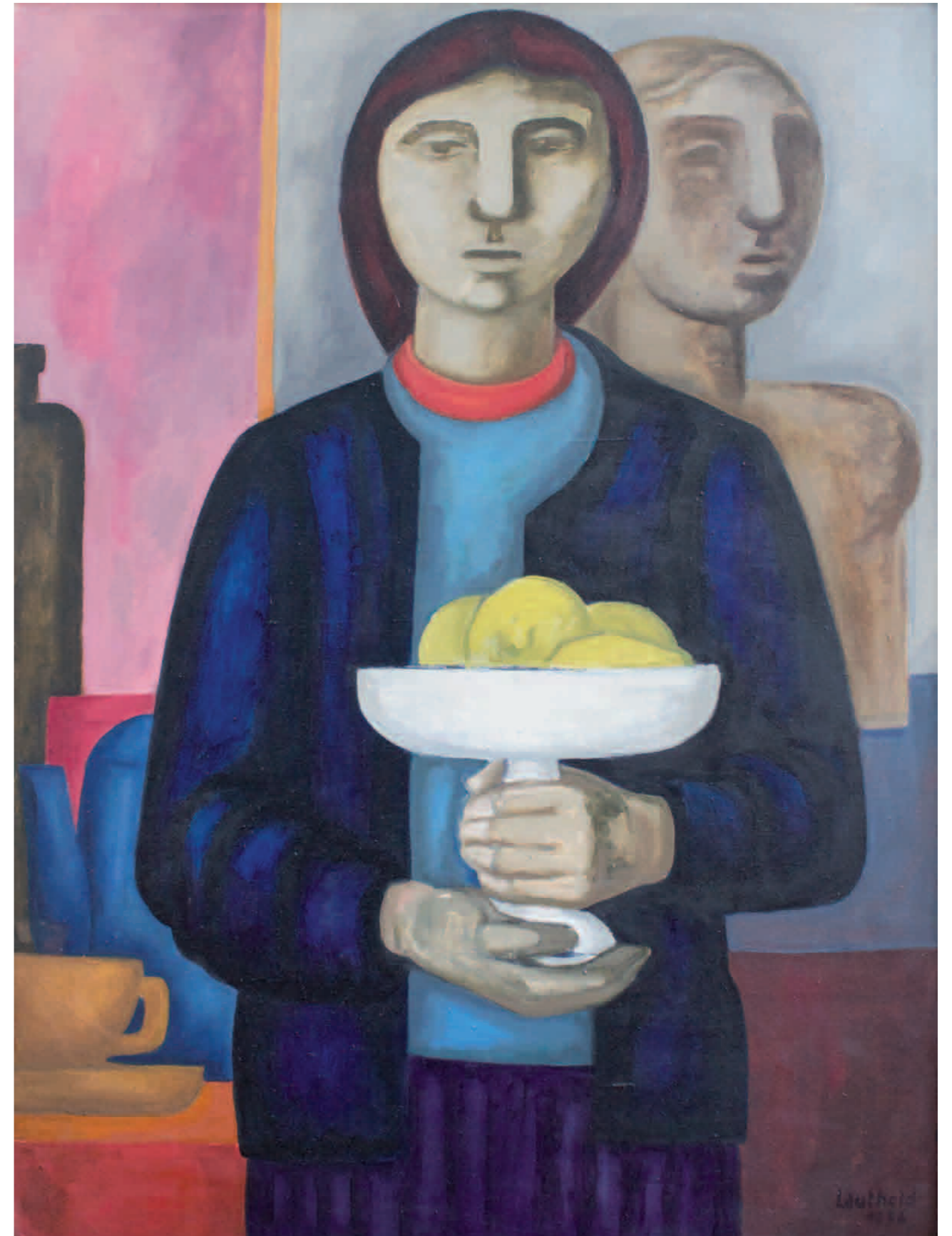
Frau mit Obstschale 1956 · Öl auf Leinwand · 90 x 67 cm