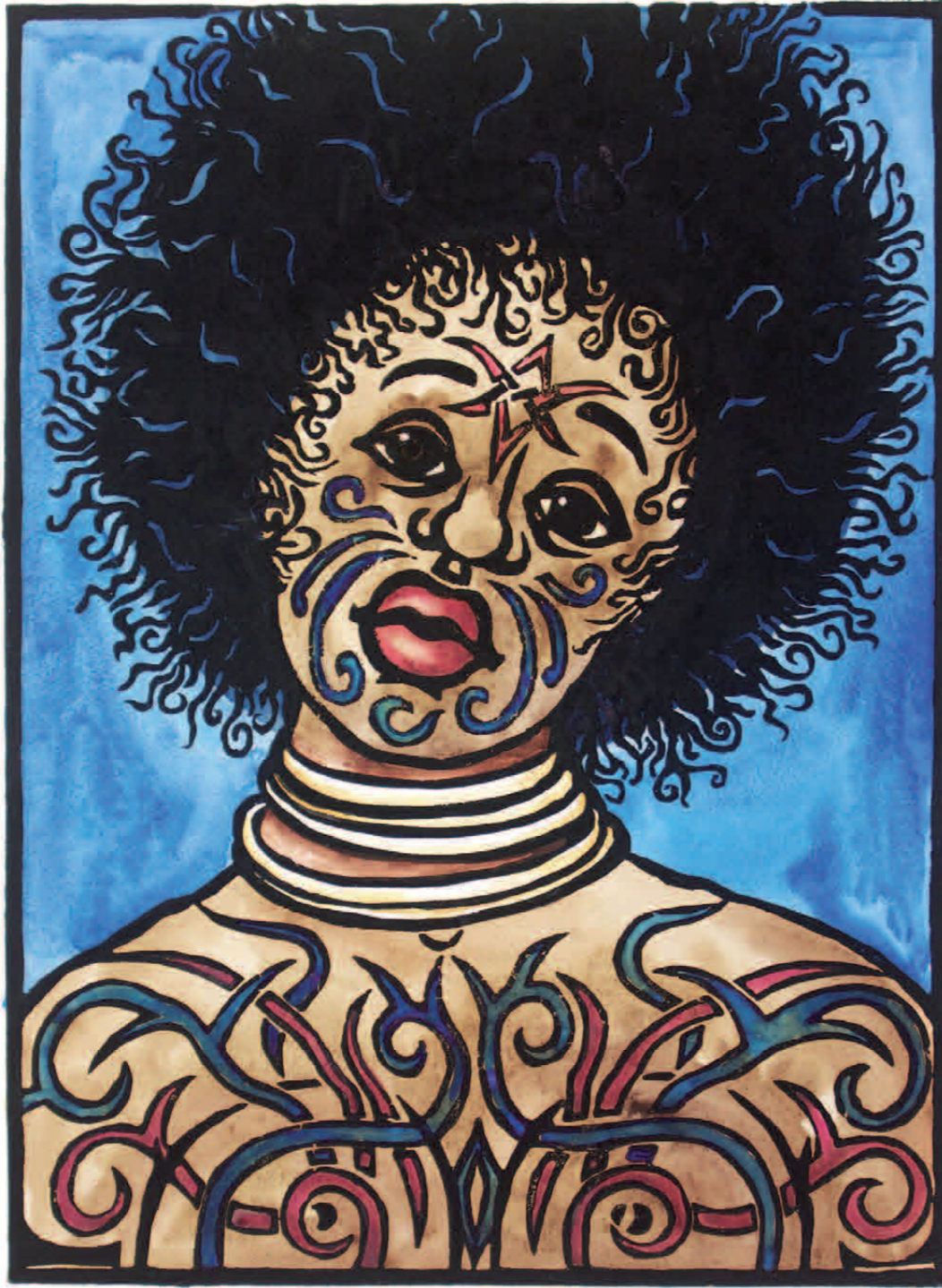
Black is beautiful

2008 · Linolschnitt mit Aquarell untermalt · 56 x 42 cm